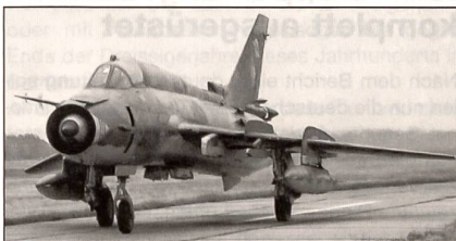
Suchoi SU-22M-4 Fitter-K der Luftstreitkräfte der Nationalen Volksarmee.