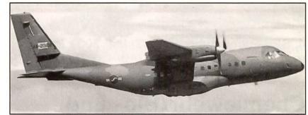
CN-235-220M der Luftwaffe Südkoreas.

Die seit 15 Jahren im Dienst der spanischen Luftwaffe stehenden Transportflugzeuge CASA/IPTN CN-235 werden in den nächsten Jahren um 9 EADS CASA C-295 ergänzt.