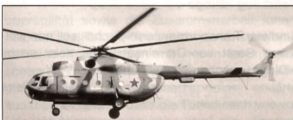
Mil Mi-9 Hip-G.

Kazan lieferte 6 mittlere Hubschrauber des Typs Mil Mi-17-1B Hip an die kolumbianischen Streitkräfte.