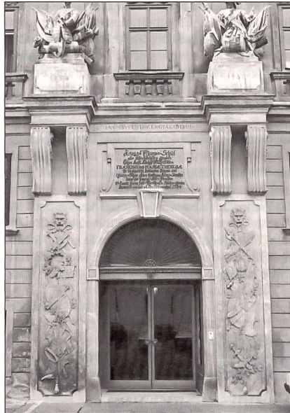
Portal der Landesverteidigungsakademie in Wien.

Im Bundesheer der Zweiten Republik wurde nach der Wiedererrichtung des Bundesheeres am 1. September 1956 das «Kommando für höhere Offizierslehrgänge» eingerichtet, damals noch der Militärakademie angegliedert. 1961 wurde dieses Kommando in «Stabsakademie» umbenannt und gleichzeitig dem Verteidigungsministerium direkt unterstellt. 1967 erfolgte die Erweiterung und Umbenennung in «Landesver-