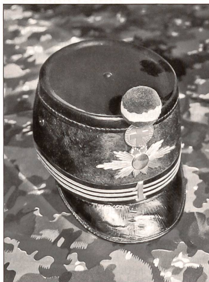
Tschako Ord. 98 des Kommandanten der (einzigen) Scheinwerfer-Pionierkompanie 1.

(jk-vo) 1898 führte die Schweizer Armee ein neues Käppi ein. Es ersetzte nach und nach das wenig stabile und ebenso unbequeme Käppi von 1869. Eine der neuen Ordonnanz ähnliche Kopfbedeckung (mit getrenntem Nacken- und Augenschirm) war bereits 1884 für die Kavallerie ausgewählt worden und hatte sich bewährt. Das Käppi Ord. 1898 war höher und bedeutend widerstandsfähiger als das bisherige. Verbessert wurde auch das Innenleben, also der Tragkomfort. 1916 kam es dann auf Grund der Erfahrungen des Ersten Weltkrieges zur Einführung des