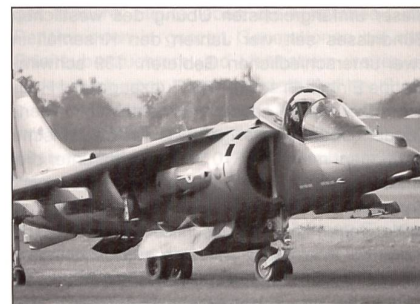
«Harrier» GR7 der Royal Air Force.

Das britische Verteidigungsministerium plant nun eine Rationalisierung und Restrukturierung der beiden bestehenden «Harrier»-Elemente. Es soll eine «mehr befähigte und echt gemeinsame» «Harrier»-GR9-Kraft werden. Die neue Organisation wird ein Übergang zu dem neuen «Future Joint Aircraft» ab 2012 werden. Man will damit ein grösseres Gewicht auf eine offensive Luftkraft legen, die vom Flugzeugträger aus eingesetzt werden kann. Das Beispiel der US-Seestreitkräfte, wie sie es derzeit in Afghanistan demonstrieren, ist dabei das Vorbild. Das «Sea Harrier»-Modell wird deshalb früher als ur-