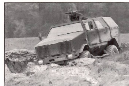
Gepanzertes, geländegängiges Transportfahrzeug «Dingo».

Nach dem Bericht einer deutschen Zeitung sollen nun die deutschen ISAF-Truppen (International Security Assistance Force) in Afghanistan komplett ausgerüstet sein. Nach den ursprünglich verlegten sechs gepanzerten Transportfahrzeugen «Dingo», sechs Luftlandepanzern «Wiesel», drei gepanzerten Lastkraftwagen «Wolf»