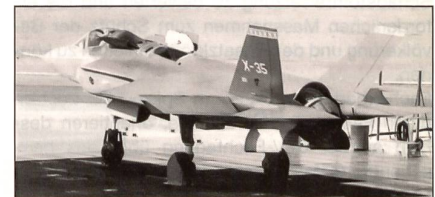
Prototyp X-35B STOVL (short take off/vertical landing).

Die Indienststellung der ersten von 609 Kampfflugzeugen Lockheed Martin F-35C (JSF, Joint Strike Fighter) ist ab 2008 vorgesehen.