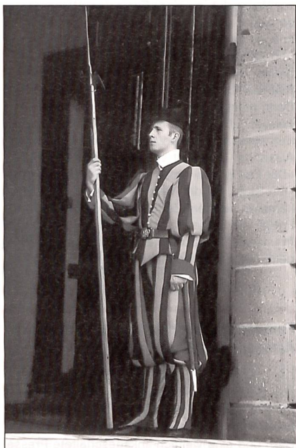
Die Schweizergarde als Wach- und Schutztruppe des Papstes ist mehr denn je gefordert.