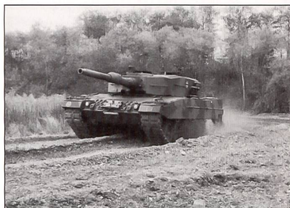
«Leopard»-2A4 der deutschen Bundeswehr.

Finnland will damit die beiden Panzerbrigaden ausrüsten, die es für den Kriegsfall bereithält. Gegenwärtig haben die finnischen Streitkräfte 162 T-72 (sowjetische Modelle) in Betrieb, die sie in den frühen Neunzigerjahren von Deutschland (aus NVA-Beständen) erworben haben. Auch etwa 70 (sowjetische) T-55M-Kampfpanzer sind noch im Bestand. Die Nachrüstung der ehemals sowjetischen Modelle aber würde wesentlich