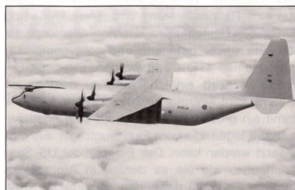
C-130 «Hercules» der Royal Air Force.

London hat aus den Beständen der RAF drei gebrauchte, aber generalüberholte Flugzeuge des Typs C-130K «Hercules» angeboten. Als Verkaufspreis werden rund 33 Millionen Euro für alle drei Maschinen genannt. Nach der Generalüberholung könnten die Transportflugzeuge noch weitere 20 Jahre im Dienst stehen.