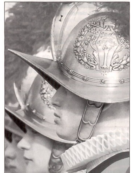
Seit 1506 im Dienst von Papst und Kirche.

Reisläufer, Leibwächter, Sicherheitsspezialist, aber auch Publikumsmagnet und Fotosujet. Das ist der Schweizergardist. Allein zur Dekoration dient sie also keineswegs, die letzte Schweizerkompanie in fremden Diensten.