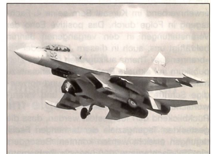
Suchoi SU-30 Flanker der russischen Luftwaffe.

Als Nachfolger für die Northrop F-5E Tiger II und McDonnell F-4E Phantom II sollen für 4 Mia. $ etwa 40 neue Kampfflugzeuge beschafft werden. Im Rennen sind gegenwärtig noch Eurofighter Typhoon, Boeing F-15K (Derivat der F-15E Strike Eagle der USAF), Dassault Rafale und Suchoi SU-35 Flanker. Der Beschaffungsentcheid soll noch in diesem Jahr fallen.