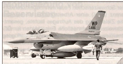
F-16 der USAF.

Das Kampfflugzeug-Programm Lockheed Martin/Northrop Grumman/BAE Systems F-35 bildet das gegenwärtig weltweit grösste Rüstungsgeschäft; allein die im November 2001 begonnene Entwicklungsphase kostet 18 Mia. $. Beispielsweise sollen in der USAF ab dem Jahr 2010 nicht weniger als 1750 F-35 die A-10 und die F-16 ersetzen.