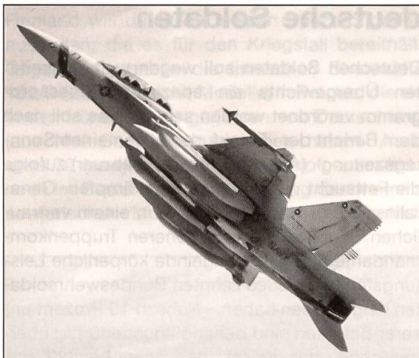
Mit Störbehältern AN/ALQ-99 ausgerüstete F/A-18F Super Hornet der USN.

Boeing erprobt gegenwärtig im Auftrag der US Navy modifizierte F/A-18F Super Hornet im Hinblick auf die Nachfolge der Grumman EA-6B Prowler.