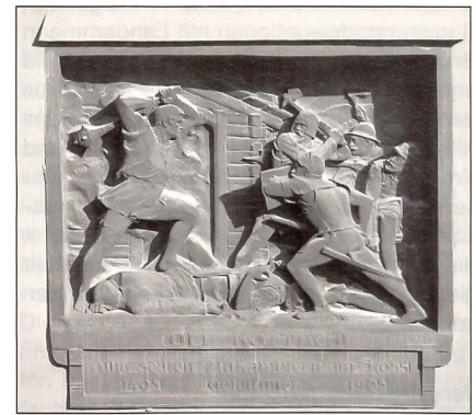
... und als Relief von Walter Mettler.

Ich «vernahm das Klirren von Rüstungen, den Stampf von Kriegern und Rossen, Harsthörner erschollen, Hellebarden und Morgensterne blitzten, es war mir, als seien die alten Eidgenossen noch einmal