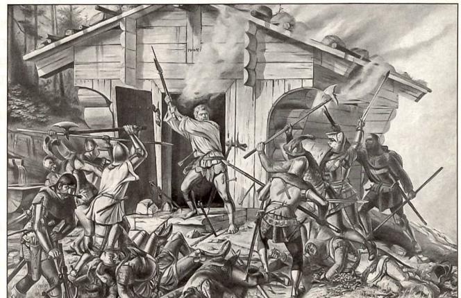
Uli Rotachs Kampf am Stoss – dargestellt von Karl Jauslin (aus: Schweizer Wehrgeist in der Kunst) ...

1405 folgte die zweite Auflage am Stoss, hoch über dem Rheintal, bei Gais. Erneut geriet der Angreifer, ein 4000 Mann starker habsburgischer Heerhaufen, Verbündeter des Abtes von St. Gallen, in die Falle. Erneut unkonventionelle Partisanentaktik kontra ritterlichen Kampf in offener Feldschlacht. Der Chronist notierte: «Und so si wider durch die letzi soltent (...) ward