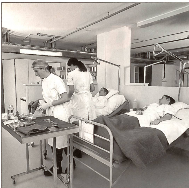
Pflegestation im Militärspital. Vorbereitung für Verbandswechsel.

Les deux sont nécessaires; ils agissent conjointement et dans leur intérêt commun.