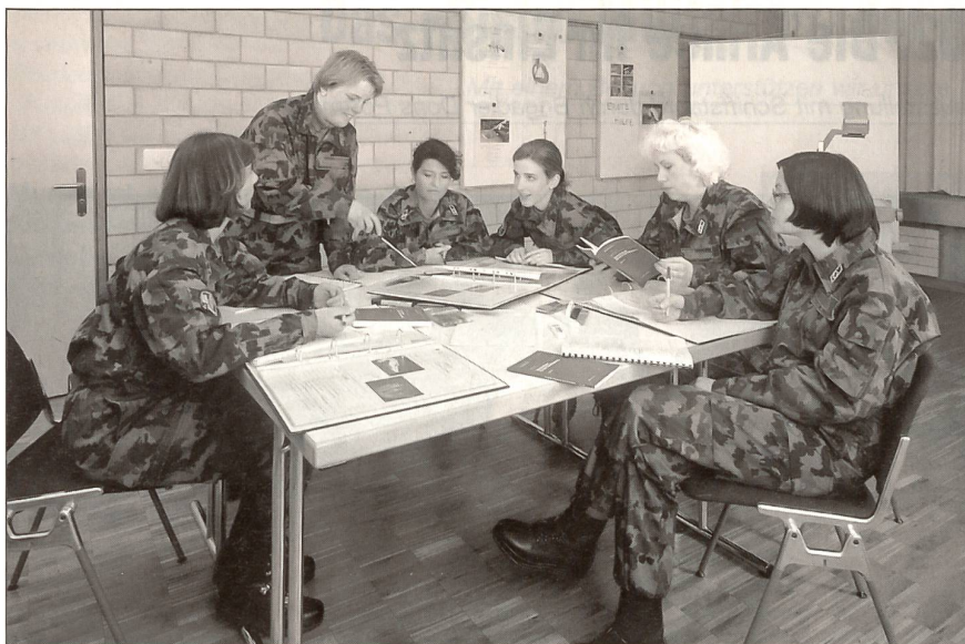
Gruppenunterricht im Klassenzimmer.