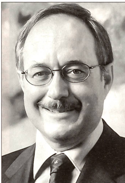
Bundesrat Samuel Schmid, Chef des Eidgenössischen Departementes für Verteidigung, Bevölkerungsschutz und Sport.

Der Bundesrat und unsere Bevölkerung danken Ihnen dafür herzlich.