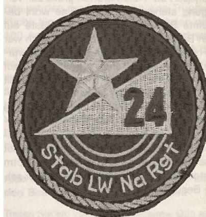
Badge im Dunkelblau der Flieger- und Flab Trp, markanter, satt-goldener Nachrichtenstern