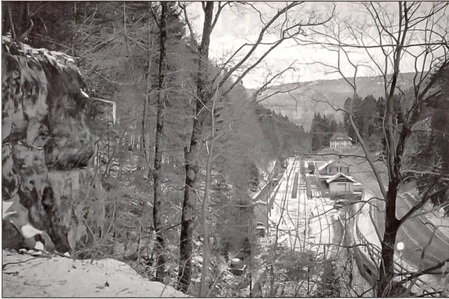
Sperrstelle Gännsbrunnenspanorama vom Infanteriebunker Gännsbrunnenspanorama mit dem Bahnhof Gännsbrunnenspanorama am Nordportal des Weissensteintunnels. Der Grundrissplan und die Innenansicht lassen die nachträgliche Umrüstung von 8,4-cm-Feldkanone auf 4,7-cm-Panzerabwehrkanone mit Pivotalafette erkennen.

Zahlreiche Vereinigungen helfen mit, solche historische Stätten der Öffentlichkeit zugänglich zu machen.