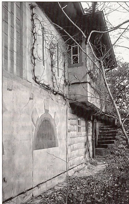
Sperrstelle Angenstein: Als Schlossscheune getarntes Infanteriewerk vor dem Schloss Angenstein.

Am Beispiel Zug lässt sich gleich noch ein anderes Anliegen des VBS darstellen. Es geht um den Besucherbetrieb in den unter Denkmalschutz gestellten Anlagen. Hier sind private Vereinigungen wie die Militärhistorische Stiftung des Kantons Zug gefragt, welche sich für die Organisation und Durchführung von Besuchstagen und Gruppenführungen zur Verfügung stellen. Glücklicherweise besteht schon seit zwei Jahren der Verein «Festungswerke Solo-