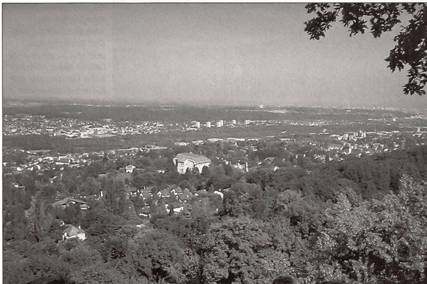
Sperrstelle Dorneck: Panoramabild vom Beobachtungsposten auf dem Turm der Burgruine Dorneck.

leitung des VBS seit einigen Jahren ein Inventar jener Infrastrukturen, die zwar militärisch nicht mehr gebraucht werden, aber aus geschichtlichen, kulturellen oder ökologischen Gründen trotzdem erhalten bleiben sollen. Bereits erstellt und vom Departement genehmigt sind die Inventare für die Kantone Tessin, Neuenburg, Jura, Zug, Schaffhausen, Thurgau, Luzern, Nid- und Obwalden. Nun konnten im Einvernehmen mit den betroffenen Kantonen auch die Inventare Solothurn, Basel-Stadt und Basel-Landschaft fertig gestellt werden. Am vergangenen Donnerstag sind diese im Bei-