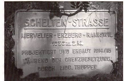
Sperrstelle Scheltenpass: Gedenktafel an der Scheltenpassstrasse.