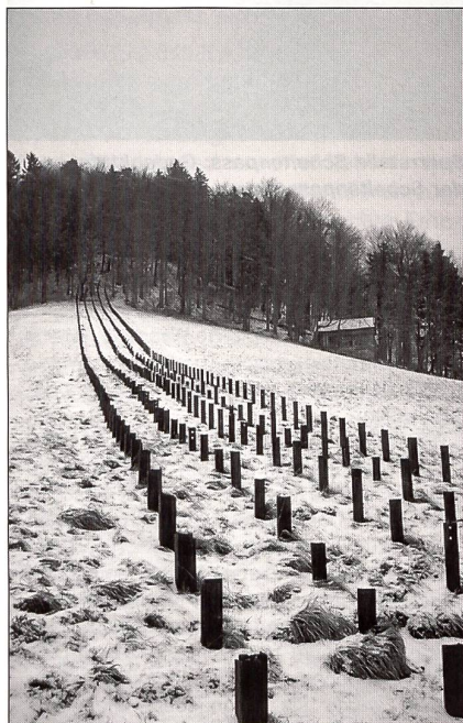
Sperrstelle Belchen: Blick von Südwesten auf das Geländepanzerhindernis auf der Chalhöchi.

Das EMD hat diese Bedeutung und die damit verbundenen Verpflichtungen frühzeitig erkannt. Bereits 1992 hat die damalige Departementsleitung eine Arbeitsgruppe eingesetzt, um die geschichtliche, kulturelle und ökologische Bedeutung dieser Bauten und Anlagen systematisch zu erfassen und zu bewerten. Heute sind bereits 12 Kantonsinventare fertig gestellt und vom Generalsekretär VBS genehmigt worden.