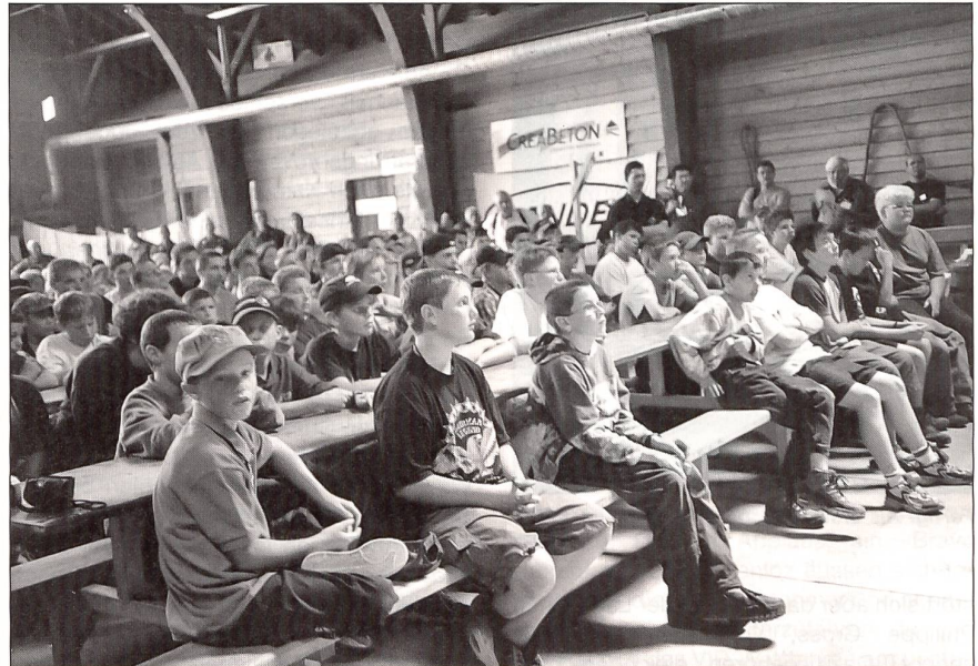
Aufmerksame Zuhörer bei den Ansprachen der militärischen Besucher.

Pontonier scheint etwas speziell Schwei-zerisches zu sein. Es wird auch in der A XXI Pontoniere mit modernen Schlauchbooten, Übersetzbooten und Weidlingen geben. Wenn man bedenkt, dass in der Schweiz nur wenige Flüsse so schiffbar sind, dass seriöser Wasserfahrtsport betrieben werden kann, ist es sehr beachtlich, dass der SPSV über 41 Sektionen verfügt! Einmal motiviert, entdeckt man auf Bahnfahrten oder Wanderungen entlang der Aare, Rhein, Limmat oder Reuss die Gebäude der Vereine, oft noch mit Pontonier-Fahr-verein angeschrieben. Hier lagert Material, hier findet vom Frühling bis zum Herbst ein Grossteil des Vereinslebens statt. Einst vor mehr als 100 Jahren als rein ausserdienstlicher Verband mit militärischen Strukturen gegründet, hat sich die Organisation ge-wandelt. Immer noch steht natürlich die militärische Einteilung bei den Pontonieren im Vordergrund und damit das Schwere-gewicht der ausserdienstlichen Tätigkeit. In-zwischen können auch Mädchen und Frauen mitmachen, und die Übungen sind mehr sportlicher denn militärischer Art. Deshalb auch die Wandlung von Ponto-nier-Fahrverein zu Pontonier-Sportverband. Da unser Militärdepartement ja auch Sport