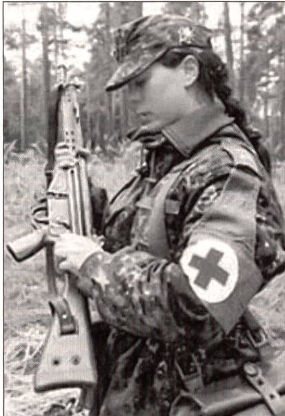
Die Bewaffnung der Frauen gehört heute auch in Deutschland zum Alltag.

Die Jahresbilanz der Bundeswehr fällt positiv aus: «Frauen sind ehrgeizig, zielstrebig, leistungsorientiert, willensstark. Sie spornen ihre männlichen Kameraden zur