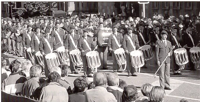
Um die 30 000 Zuschauer sahen den traditionellen Umzug am «Fête des Vendanges»