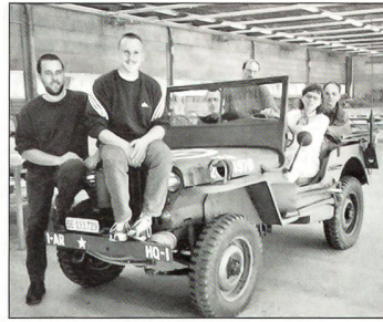
Titelbild: Besuchstag G RS 256 – Viele der angereisten Eltern staunten über das militärische Können ihrer Söhne.