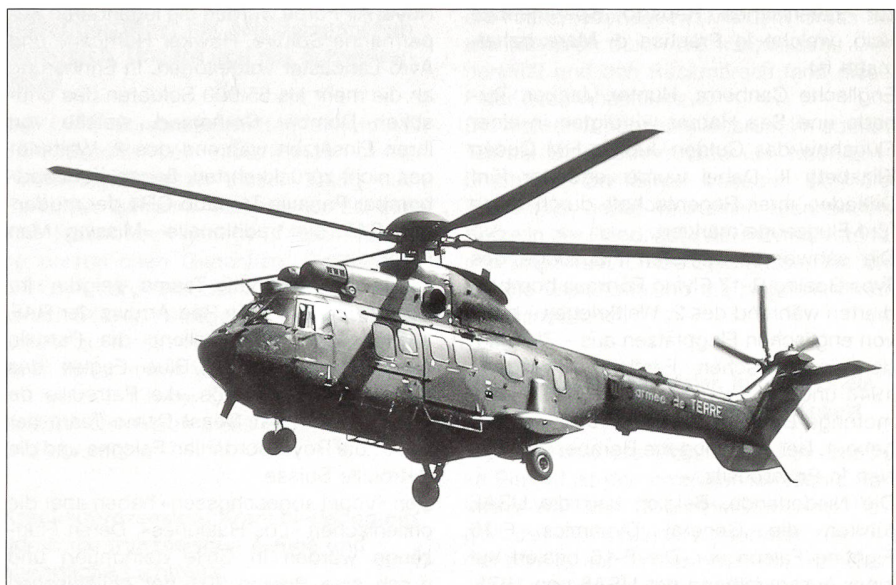
Cougar der Armée de Terre.

Grosses Interesse erweckten eine Lockheed MC-130H, eine Lockheed MC-130P und ein bewaffneter Rettungshubschrau-