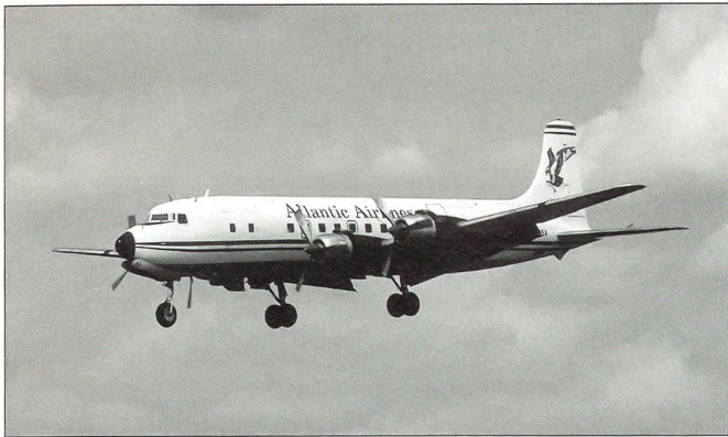
DC-6 der Air Atlantique.

gensatz zu früheren Jahren waren die Staaten der ehemaligen Sowjetunion – mit Ausnahme Litauens – trotz grossspuriger Vorankündigungen der britischen Veranstalter nicht präsent. Ebenso fehlten Kontingente beispielsweise von Österreich, Schweden, Ungarn und Norwegen. Leider ist eine zunehmende Tendenz festzustellen, dass Firmen diesen Anlass als Werbepattform nutzen. Beispielsweise waren jedem Besucher fast unabhängig von seinem Standort stets Plakate der grössten britischen Rüstungsfirma vor Augen. Immerhin könnte diese Einflussnahme der Wirtschaft die künftige Wiederdurchführung dieses Grossanlasses sicherstellen. Besonders gut betuchte Zuschauer wurden von Charterflugzeugen direkt auf den Flugplatz eingeflogen. So konnten in der Anflugschneise einige interessante Verkehrsflugzeuge gesichtet werden: Dazu gehörten beispielsweise mehrere Douglas DC-3 / Dakota, eine Boeing 777 der British Airways und eine Douglas DC-6 der Air Atlantique.