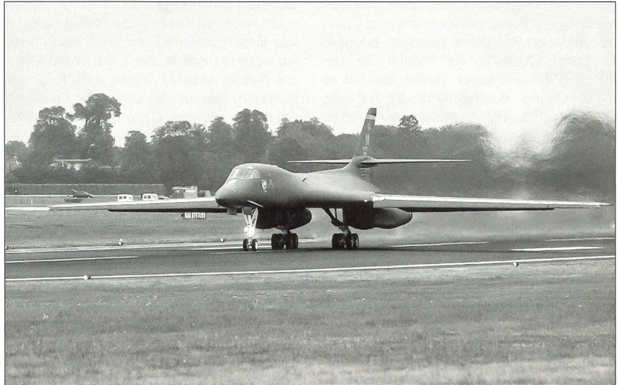
Rockwell B-1 Lancer der USAF.

Beim Royal International Air Tattoo 2002 handelte es sich – auch was die Anzahl beteiligter Flugzeuge betrifft – um den welt-