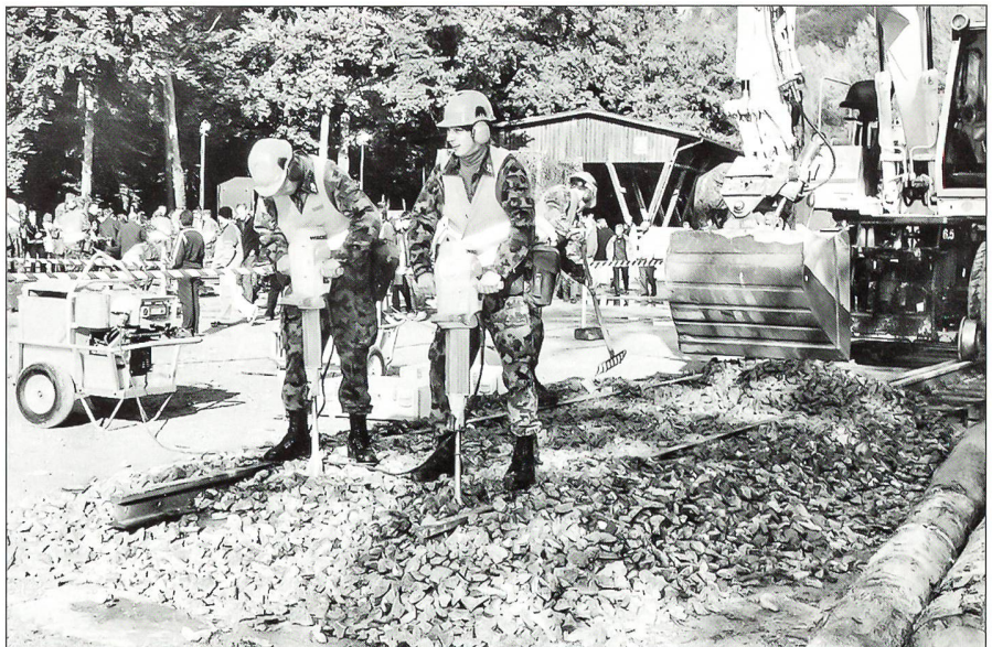
Eisenbahnsappeure beim Gleisbau

Positiv: Dass in der Genie RS 256/02 pro Monat eine Lohnsumme von (inklusive Kader) fast 900 000 Franken ausbezahlt wird. Negativ: Seit Beginn der RS vor 11 Wochen mussten – aus verschiedenen medizinischen Gründen – sage und schreibe 103 Mann entlassen werden. Die meisten davon in den ersten 14 Tagen. Diese Zahl gibt zu denken! König informierte im Film-