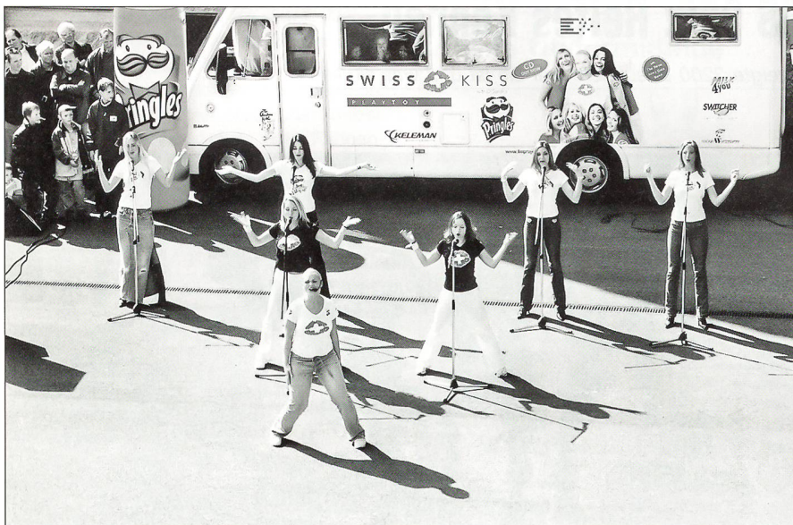
Die «Swiss Kiss»-Girls in Aktion

heiten eine kleine attraktive Show. Alle gehörten einmal zu den Miss-Schweiz-Kandidatinnen. Das «Swiss Kiss»-Team machte seine Aufwartung schon bei