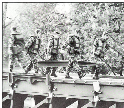
Beim Bau der Festen Brücke 69

len unsere Leute am Schluss der RS gesund nach Hause entlassen!» Nach dem Vorbeimarsch der vier Kompanien ging es dann nichts wie los zu den verschiedenen Arbeitsplätzen. Und da kamen dann die Zivilisten – allen voran die Freundinnen und die Eltern der Rekruten – ob dem «was die schon alles können» – aus dem Staunen kaum mehr heraus. Ob im Bataillonskommandoposten der Stabskompanie, beim Gleis- und Fahrleitungsbau der «Eisenbahner», bei den Rammponktionieren, den Brückenbauern oder bei den Baumaschinenführern, Motorfahrern und wie die Spezialisten alle heissen: Was man da zu sehen bekam, verdient Applaus. Das gilt auch für das Showkochen von jenem Rekrut der Stabs-Kp, der feine runde Schenkeli (mmmhh!!) machte, und für die Ticinesi, die in einer lustigen «Sfilata di Moda» die ganze Tenü-Kollektion der jungen Genisten präsentierten.