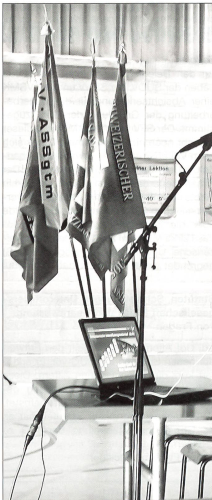
Unter den vier Verbandsfahnen

des Zugführerstellvertreters absolvieren.