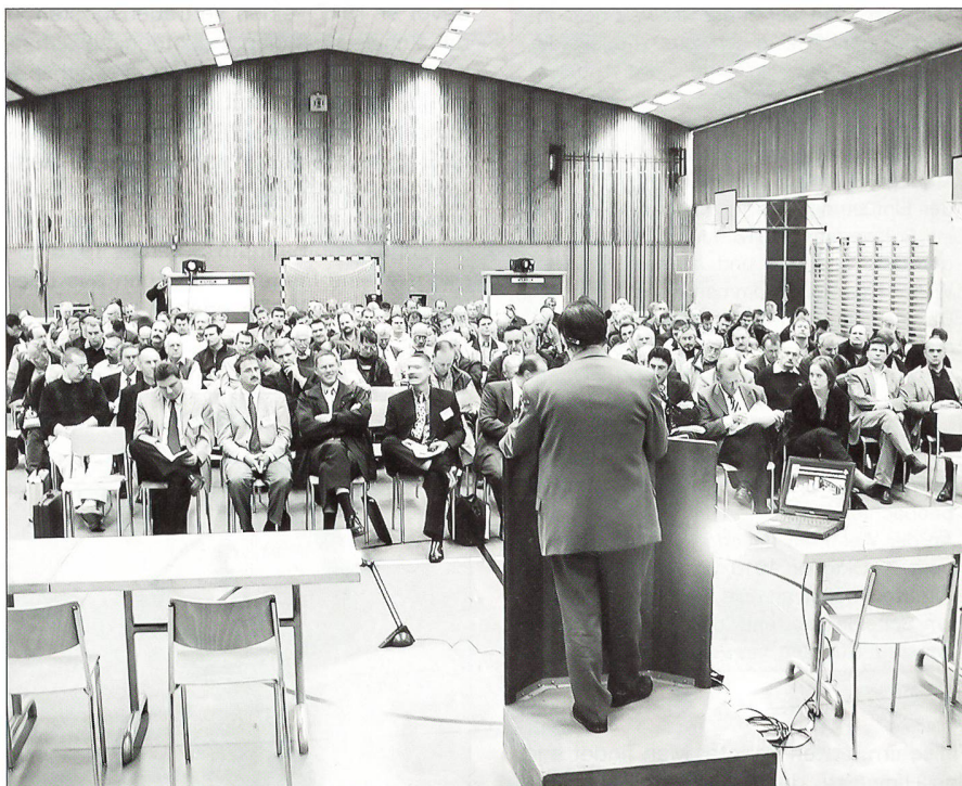
Über 160 Personen folgten gespannt den Ausführungen

Die erste Eingabe der Arbeitsgemeinschaft an die Planer der Armee XXI vom 29. Juni 1999 betreffend Funktionen, Aufgaben und Laufbahnen der Unteroffiziere ist zunächst nicht auf grosse Beachtung gestossen. Erst im Nachfassen gelang es in einer Besprechung mit dem Chef der Studie Ausbildung zu vermitteln, dass es hierbei um die Meinung aller Unteroffiziersverbände