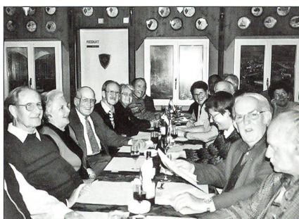
Alle warten gespannt auf das Mittagessen «Suppe aus dem Gamellendeckel» und die «Wachhüsli-Pastetli».

vom Februar 1871, wo gegen 90 000 Mann von der französischen Armee des Generals Charles Bourbaki (1816–1897) die Grenze bei Les Verrières überschritten und in der Schweiz Aufnahme fanden. Diese Soldaten hatten ursprünglich den Auftrag, gegen Ende des Deutsch-Französischen Krieges, die Stadt Belfort von den deutschen Truppen zu befreien. Das Unterfangen scheiterte kläglich an der Lisaine, und der verbliebene «Haufen» musste samt Pferden unter unmenschlichen Strapazen in extremer Kälte in die Schweiz flüchten. Im Panorama selbst wird das Geschehen durch Pferdewiehern und fernem Geschützdonner realistisch untermalt. Alle Besucher waren von dem Riesengemälde tief beeindruckt, sodass für das eingehende Betrachten eine Stunde fast zu kurz war. Der zweite Höhepunkt des Tages galt dem Besuch des Militärmuseums im «Schild Bunker» am Rotsee. Stabsadj Josef Wüest gelang es, uns Besucher auf humorvolle Art in seinen Bann zu ziehen. In diesem Museum kann man Waffen und Requisiten, eine Riesensammlung von Uniformen und Abzeichen der Schweizer Armee ab dem 19. Jahrhundert sowie solche der UNO, der OSZE, aus Korea, von der Schweizergarde, dem Zoll und viele andere mehr besichtigen.