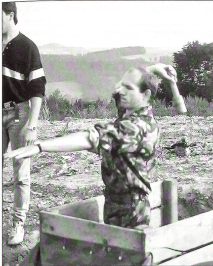
Zielwurf als Punktesammler.

Die Beteiligung hat allmählich die Möglichkeiten bezüglich Personalaufwand und Material des UOV Bischofszell überstiegen. Das Organisationskomitee beschloss, eine Pause einzulegen.