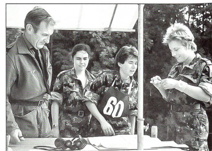
Gut organisierte Postenarbeit bedingt seriöse Vorbereitung.

Ein Zitat aus dem Buch des Verbandes der Reservisten der deutschen Bundeswehr, mit dem Titel: Freiwillige Reservisten – Arbeit 1962 – 2002 sagt aus: Bischofszell ist das Wettkampfdorado für uns Reservisten der Bundeswehr.