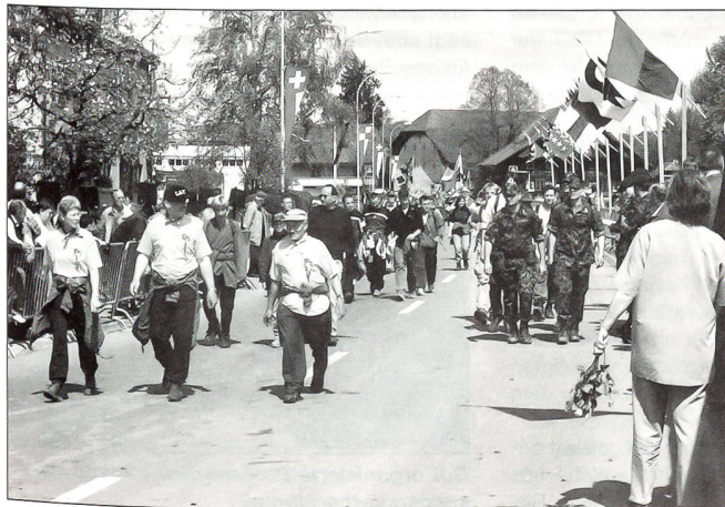
Einmarsch der Nationen auf der neuen Einmarschstrecke, Mühlestrasse in Belp.

Kameradinnen und Kameraden macht Werbung für den Schweizerischen Zwei-Tage-Marsch,