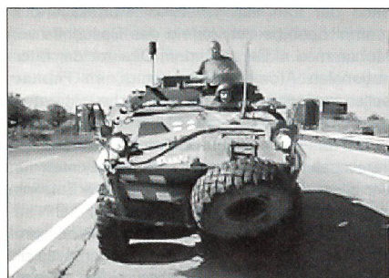
NATO-Truppen der Vorgängeroperation Fox.

In Zukunft werden neben den territorialen Verteidigungsaufgaben internationale Solidaritäts-