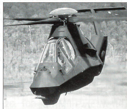
Boeing RAH-66 Comanche

Gemäss heutiger Planung wird die Anzahl zu beschaffender Mehrzweckhubschrauber vom Typ Boeing Sikorsky RAH-66 Comanche von 1213 auf 650 herabgesetzt.