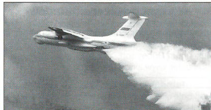
Als Feuerlöschflugzeug ausgerüstete russische Ilyushin IL-76 Candid