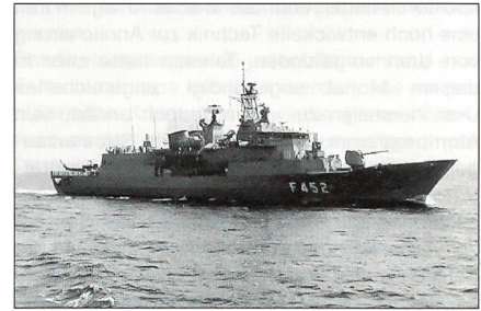
Griechische MEKO-200-Fregatte T-452.

Prinzipiell haben sich die Streitkräfte dem allgemeinen Trend zu quantitativ reduzierten, qualitativ besser ausgerüsteten, professioneller geführten und mobileren Streitkräften zu stellen. Der Truppenumfang (ohne Ministerium) soll von derzeit 166 000 auf 140 000 Personen reduziert werden. Den 80 000 Wehrpflichtigen werden künftig 60 000 Berufs- und Zeitsoldaten zur Seite stehen. Davon sollen 15 000 Personen für Krisenreaktionskräfte aufgestellt werden. (Auf der Capability Commitment Conference 2001 der EU hat Athen erklärt, der EU-Eingreiftruppe 4000 Mann, 40 Flugzeuge – davon 30 Kampfflugzeuge –, sechs Hubschrauber, sechs Fregatten und ein Unterseeboot zur Verfügung zu stellen.)