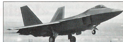
F-22 CTF Raptor

Infolge Kostenüberschreitungen werden die Produktionszahlen für das Kampfflugzeug Lockheed Martin F-22 Raport verkleinert auf 27 im Jahr 2004 und 32 im folgenden Jahr.