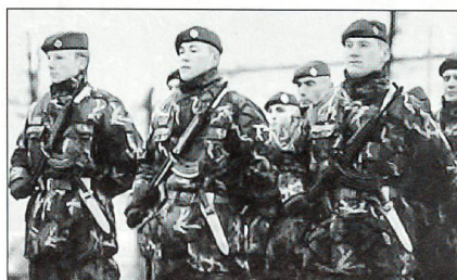
Modell 2010: Slowakische Soldaten – alle nur noch Profis.

52 Kampfpanzer, 164 gepanzerte Fahrzeuge, 96 Artilleriesysteme (einschliesslich von Raketenwerfern), 98 Granatwerfer, 9 mobile Fliegerabwehrlenkwaffensysteme.