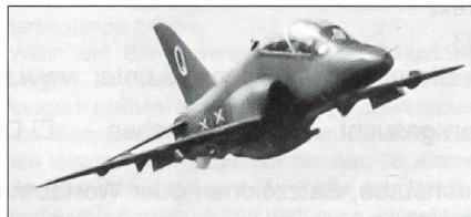
BAE Hawk der Royal Air Force

Nach 12 Jahren Ausbildungseinsatz und gesamthaft nur 19 000 Flugstunden wurden alle 19 noch vorhandenen Trainingsflugzeuge des Typs British Aerospace Hawk ausser Dienst gestellt und zum Verkauf durch die RUAG freigegeben. Nicht ausgeschlossen ist die spätere Beschaffung des Flugzeuges Pilatus PC-21.