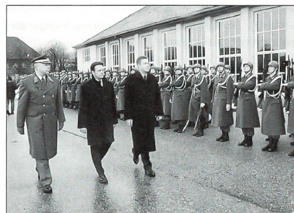
Günther Platter übernahm Verteidigungsressort. Amtsübernahme: Ex-Minister Scheibner, Minister Platter, Generalstabschef General Ertl (im Bild von rechts).

Der Stab (mit Kommando) der Brigade hat 22 Offiziere und Warrant-Offiziere. Seit 1. Januar dieses Jahres können Übungsaktivitäten entsprechend den NATO-Standards durchgeführt werden. Gleichzeitig wurde das Hauptquartier mit 40 zusätzlichen Offizieren und Warrant-Offizieren erweitert. Diese sollen dann während der Einsätze in ihren ursprünglichen Positionen und Truppenteilen arbeiten, um die Zusammenarbeit in dem gesamten Verband zu erleichtern. In geplanten gemeinsamen Aktivitäten und Übungen soll die Brigade mit ihrem Stab und den unter-