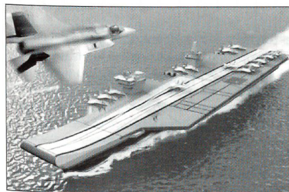
Illustratorbild des britischen Flugzeugträgers

Unter der Federführung von BAE Systems und Thales sollen für die Royal Navy zwei neue Flugzeugträger gebaut werden. Sie verdrängen etwa 60 000 t, sind mit Kampfflugzeugen des Typs Lockheed Martin F-35B ausgerüstet und voraussichtlich in den Jahren 2012 respektive 2015 operationell.