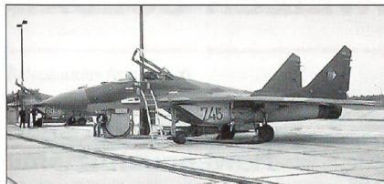
MiG-29 in den Farben der ehemaligen DDR

Zu den bereits im Einsatz stehenden 15 MiG-29 Fulcrum liefert Russland weitere 14 Kampfflugzeuge des gleichen Typs.