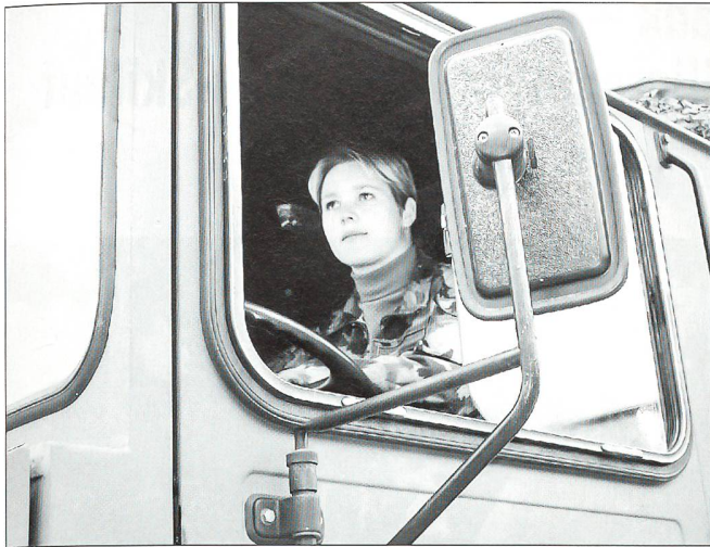
Übung macht den Meister.

kurzfristigen Kommandierungen und Einsätze bis spät am Abend aber kaum möglich. Um so wichtiger ist ihr deshalb ihre Privatsphäre. Sie wohnt mit ihrem Hund in einer eigenen Wohnung ausserhalb des Waffenplatzes, obwohl sie kostenlos in der Kaserne übernachten könnte: «Ich brauche diesen Freiraum, um abschalten zu können.»