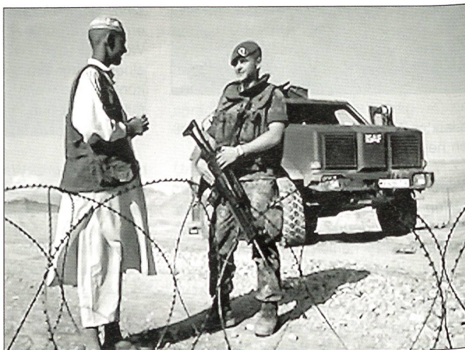
Bundeswehreinsatz in Afghanistan.