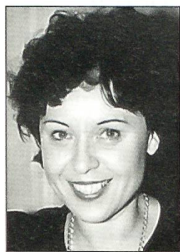
Von Tina Mäder, Wien

verantwortlich für die Führung aller ihm unterstellten Einsatzkräfte. Das Kommando ist truppendienstlich ein Teil der neu geschaffenen Streitkräftebasis, in der alle gemeinsamen Aufgaben von Heer, Luftwaffe und Marine wahrgenommen werden. Weil sich das Spektrum der Einsätze der Bundeswehr erweitert hat, war es notwendig geworden, diese Kommandostelle zu