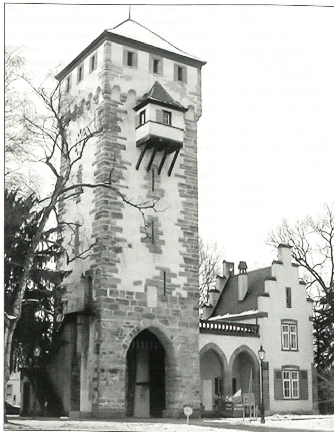
Das St. Alban-Tor im Februar 2003. Der Turm hat seit 1977 wieder ein historisch stilgerechtes Dach. Als Anbau neben dem Tor steht ein kleines Gebäude im Stile der Neugotik, welches bei der Neugestaltung 1871/73 als Polizeiposten angebaut wurde.

Rudolf Kaufmann, Basel das alte Stadtbild, 1936, Birkhäuser Verlag C.A. Müller, Die Stadtbefestigung von Basel, 1956, Helbing & Lichtenhahn Jahresbericht 1989 der Archäologischen Bodenforschung BS, Katalog der landseitigen Äusseren Grossebasler Stadtbefestigungen Guido Helmig, Jahresbericht 1985 der Archäologischen Bodenforschung BS in der Basler Zeitschrift für Geschichte und Altertumskunde C.H. Baer, Kunstdenkmäler des Kantons Basel Stadt, Band 1, 1932/71, Birkhäuser Verlag Eugen A. Meier, Basel Einst und Jetzt, 3. Auflage, 1995, Buchverlag Basler Zeitung, Helmi Gasser und Fritz Lauber, St. Alban-Tor Einst und Jetzt, 1977, Christoph-Merian-Verlag