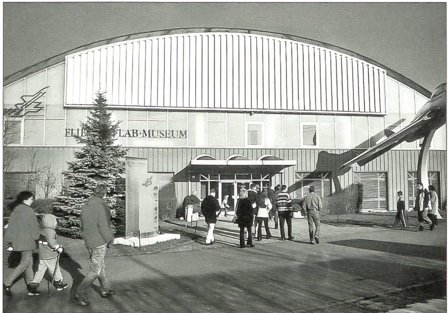
Das Flieger-Flab-Museum Dübendorf zieht immer mehr Besucher aus dem In- und Ausland an.

Im Jahre 1978 eröffnete das damalige Amt für Militärflugplätze (AMF) in Dübendorf ein Museum mit historischem Material, das bei den Fliegertruppen im Einsatz stand. Das ausgestellte Material wurde vom EMD zur Verfügung gestellt oder durch getreue Nachbauten ergänzt. Diese Flugzeugtypen wie die Blériot, die DH-1 oder DH-5, sind von pensionierten Mitarbeitern des Bundesamtes für Militärflugplätze in Buochs und Interlaken nachgebaut worden. Ein Jahr später wurde der Verein der Freunde des Museums der schweizerischen Fliegertruppe (VFMF) durch Hans Giger, Direktor AMF, gegründet. Das Sammelgut des Museums wächst in den folgenden Jahren weiter an, sodass die alten Fliegerhangars nicht mehr ausreichen, das wertvolle Material auszustellen. 1988 ist die heutige Haupthalle, eine Betonschalenkonstruktion, in Betrieb genommen worden.