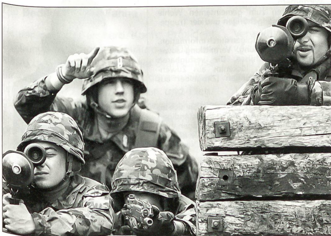
Eine ernst zu nehmende Verteidigung braucht Investitionen.

der Schweiz sowie im übrigen Europa. Man konnte damals zu Recht schreiben – was wir taten –, «wer jetzt demonstriert, lehnt sich auf gegen die UNO, das Selbstbestimmungsrecht der Völker und die Entscheidungen demokratisch gewählter Regierungen... Wenn Briten und Amerikaner, aber auch Russen, zwischen 1940 und 1945 das befolgt hätten, was man in der Schweiz dieser Tage auf Transparenten lesen konnte, nämlich dass der Krieg noch nie Probleme gelöst habe, wären wir heute alle Untertanen einer nazistischen Ordnung.» (Basellandschaftliche Zeitung 18.1.1991).