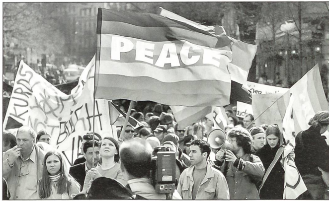
Auch die Schweizer beteiligten sich als «Mitläufer».

in der Regel nur beendet werden, wenn sich ein paar handlungsfähige Rechtsstaaten zur Tat aufraffen!