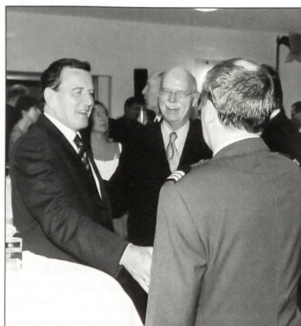
Nicht sehr oft erhält der Verteidigungsattaché Gelegenheit, in kurzen Kontakt mit den höchsten Regierungsverantwortlichen seines Gastlandes zu treten, wie hier mit Bundeskanzler Schröder und dem Bundesminister für Verteidigung Struck. Anlass war damals der Empfang bei der Amtsübergabe von Scharping an Struck.

Die Liste der abwechslungsreichen Tätigkeiten liesse sich beliebig fortsetzen, so z.B. mit Routineaufgaben wie dem Einholen von Uniformtragbewilligungen, von Sicherheitsbescheinigungen und/oder von Überflugrechten, welche von der Se-