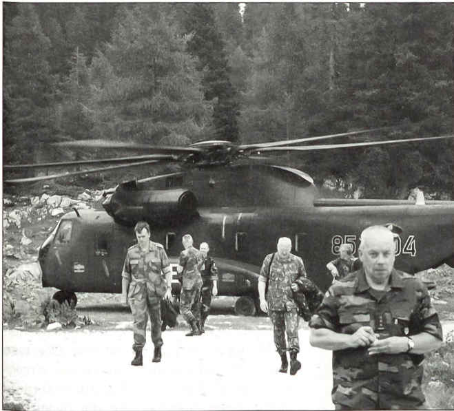
Landung mit CH-53-Hubschraubern auf der Reiteralpe oberhalb von Bad Reichenhall. Die in Deutschland akkreditierten Verteidigungsattachés konnten im Juli 2002 im Rahmen einer Heeresreise die Gebirgsjägerbrigade 23 der Bundeswehr besuchen.