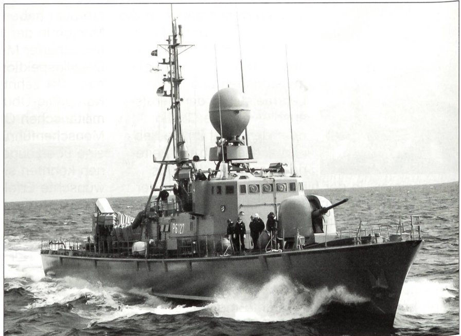
Der Verteidigungsattaché erhält hier und da auch Gelegenheit, einen Blick in die Aufgaben und Probleme einer Waffe kennenzulernen, die uns Schweizern eher fremd ist. Wie hier bei einem Besuch des Schnellbootgeschwaders 7 (Warnemünde) anlässlich einer Fahrt in der Ostsee.

Im Rahmen der Selektion werden nicht bloss Sprachkenntnisse und sicherheitspolitische Grundkenntnisse des Kandidaten geprüft, es wird auch erhebliches Gewicht auf dessen Sozial- und Fachkompetenz gelegt. Ferner wird in einem umfangreichen Testverfahren, welches dem «con-