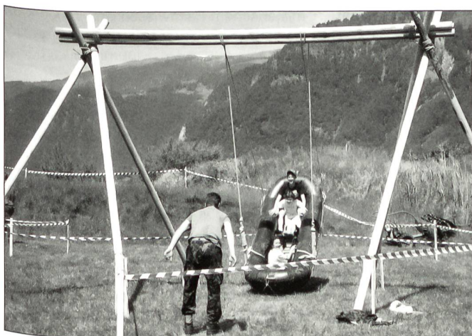
Sehr beliebt bei den Kindern, die originelle Schaukel mit dem Schlauchboot.

Als am Schluss der Vorführungen zwei Alouette 3 und ein Super Puma mit den angehängten Fahnen und dem Wahrzeichen der LTG 5 und LT Abt 5, einer aus Holz von einem Geniesoldaten kunstvoll gefertigten grossen Heuschrecke zum letzten Male vorbeiflogen, kam doch unter den Zuschauern eine gewisse Wehmut auf. Mit dem Spruch «Nicht traurig sein, das Leben geht weiter», zerstreute der Speaker diese aber rasch. Nun schwirren die auf dem Bödeli gerne gesehene Heuschrecken endgültig weg von Interlaken. Beim Wegfliegen rufen sie allen zu, addio Interlaken, auf Wiedersehen in Payerne! ❏