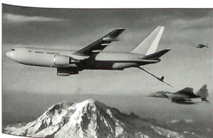
100 Boeing KC-767 werden geleast.

Tanker sind zu einem wesentlichen Element der US-Luftmacht geworden, wie dies jüngst im Krieg gegen den Irak bewiesen wurde. Da man das Ende der KC-135-Tankerflugzeuge der US Air Force herannahen sieht, glaubt man diesen kostengünstigen Schritt mit einer «minimalen Erstinvestition» machen zu müssen. Rene