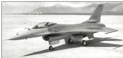
Erste F-16 der italienischen Luftwaffe

Die von der RAF geleaste 24 Abfangjäger des Typs Panavia Tornado F.3 werden ersetzt durch 34 ebenfalls geleaste General Dynamics F-16A/B Fighting Falcon, bis dann in etwa fünf Jahren die Eurofighter Typhoon definitiv in Dienst gestellt werden können.