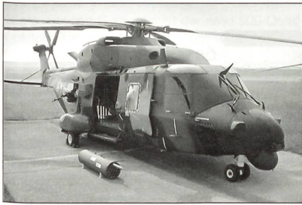
Der moderne Transporthubschrauber NH-90 wird von allen Teilstreitkräften erwartet.

die Bundeswehr durch neue Beschaffungen am Rüstungssektor an.