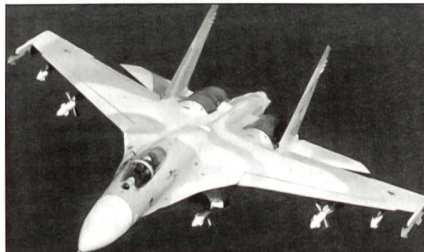
Suchoi SU-27 Flanker

Für 900 Mio. $ beschafft Malaysia 18 schwere russische zweiseitige Mehrzweckkampfflugzeuge des Typs Suchoi SU-30MKM Flanker.