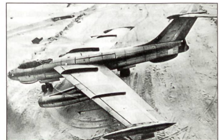
Alekseyev Typ 150

Unter grösster Geheimhaltung wurde in der Sowjetunion nach dem 2. Weltkrieg mit Hilfe deutscher Konstrukteure der Bomber Alekseyev Typ 150 entwickelt. Der Erstflug erfolgte 1951; das Flugzeug wurde aber nicht in Serie gebaut.