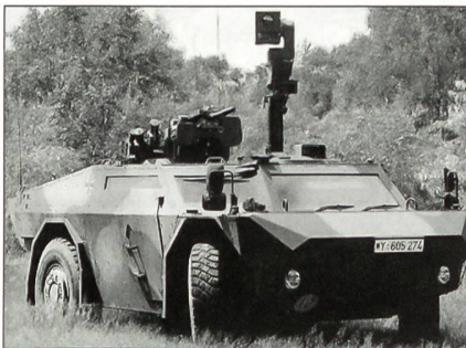
410 «Fennek» für die niederländischen Streitkräfte.

Der «Fennek» ist ein allradgetriebenes Fahrzeug, das seiner Besatzung durch seine niedrige Silhouette, sein umfassendes Schutzpaket und