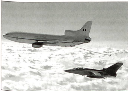
Lockheed Tristar mit Panavia Tornado F.3

Die Royal Air Force ersetzt gelegentlich ihre schweren Tankerflugzeuge der Typen Lockheed Tristar und Vickers VC-10. Um den entsprechenden Auftrag bewerben sich EADS mit den Airbus A310 und A330 sowie Boeing mit der Boeing 767-300ER.