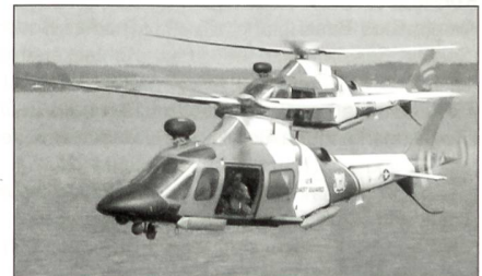
Agusta 109 der USCG, Bezeichnung HH-68A

In drei Jahren sollen die ersten beiden von insgesamt 35 bestellten Patrouillenflugzeugen des Typs CASA CN-235-300M an die amerikanische Küstenwache abgeliefert werden.