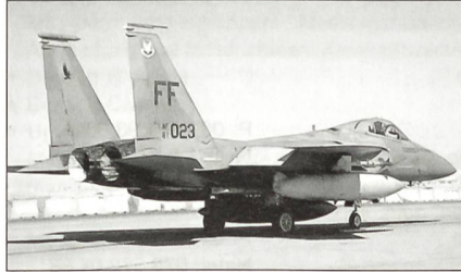
F-15C Eagle der USAF

Weltweit als Erste betreibt die indische Luftwaffe mit der Suchoi SU-30MKI Flanker Kampfflugzeuge mit Schub-Vektor-Steuerung. Die USAF ist interessiert, so bald als möglich mit solchen Flugzeugen in den USA Luftkampfübungen gegen McDonnell Douglas F-15 Eagle durchzuführen.