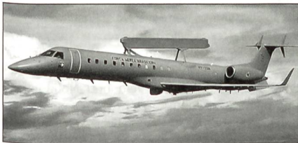
R-99A der Forca Aerea Brasileira

Die brasilianische Luftwaffe betreibt Frühwarn- und Kontrollflugzeuge mit der Bezeichnung R-99A; Basis ist die Embraer EMB-145.