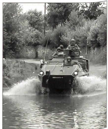
Der Transportpanzer «Pandur» ist im Kosovo unverzichtbar.

Weil die USA ihre Truppen im Kosovo reduzieren, stellen andere Brigaden pro Monat eine Kompanie ab. Die Österreicher, bisher der deutschen multinationalen Brigade zugewiesen, haben Ende Juli eine französische Kompanie abgelöst. (Angeblich hätte sich Deutschland dafür verweigert.)