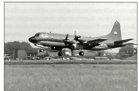
Die Bundeswehr könnte die angebotenen zehn PC-3C «Orion» gut gebrauchen.

Deutschland will seine Fähigkeit der Seeaufklärung aber auf jeden Fall behalten. Man überlegt jedoch, eine «Realisierung im europäischen