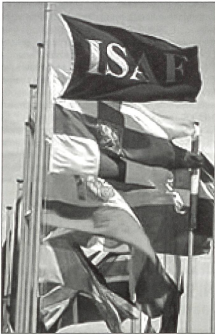
ISAF-Banner und UNO-Mandat bleiben unverändert.

Führung ab. Die Allianz ist nun für die Planung und Führung der Peacekeeping-Truppe verantwortlich. Es ist der erste Einsatz der NATO ausserhalb Europas in seiner 54-jährigen Geschichte. Dabei ändert sich weder der Name noch der Auftrag für die Operation. Sie wird wie bis jetzt unter dem Mandat der UNO und dem ISAF-Banner stehen. Das atlantische Bündnis ist auch weiterhin bemüht, Nicht-NATO-Länder als Kontingentsteller zu gewinnen. Derzeit sind Truppen aus Belgien, der Tschechischen Republik, Deutschland, Kanada, den Niederlanden, Polen, Grossbritannien und den USA im Einsatz.