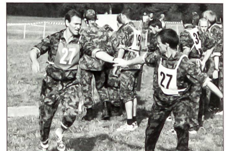
Stafettenübergabe per Handschlag.