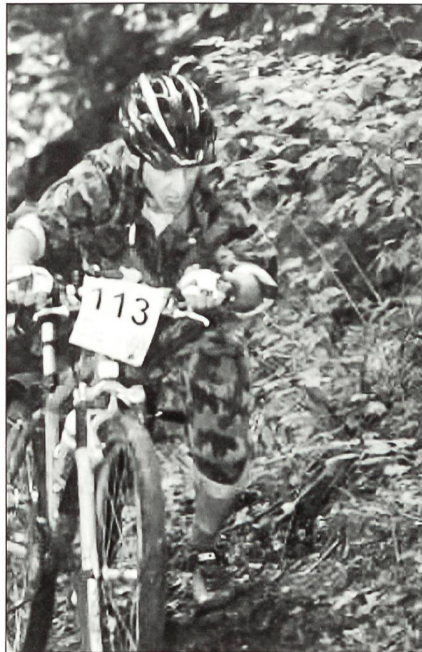
Körperlicher Einsatz beim Mountain-Bike-Cross.

Wie schätzen Sie die Rollen der militärischen Gesellschaften und Dachver-