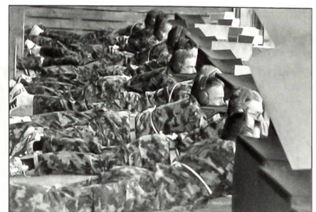
Scharfer Einzelschuss aus dem Schiessstand.

Diese Informationsveranstaltung wird unter das Motto «Gegenseitige Vorstellung» gestellt. Es ist eine Chance für beide Parteien. Eingeladen werden wiederum alle militärischen Gesellschaften und Dachverbände sowie die Verantwortlichen aller Lehrverbände. Als Ziel gilt die Förderung der Zusammenarbeit innerhalb des Verbandes, der militärischen Gesellschaften