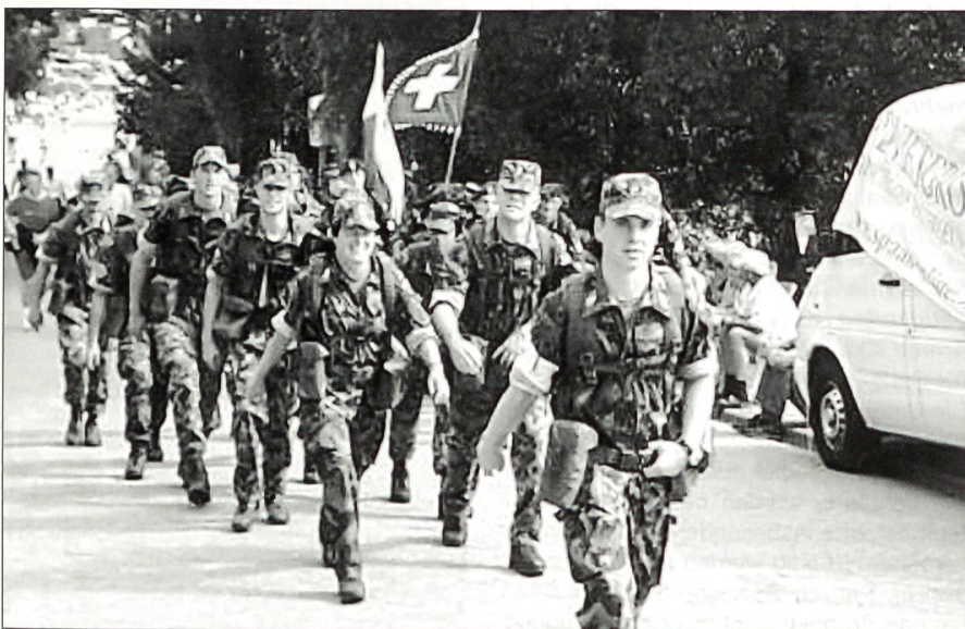
Trotz Blasen an den «Flossen» – keine Tränen vergossen!