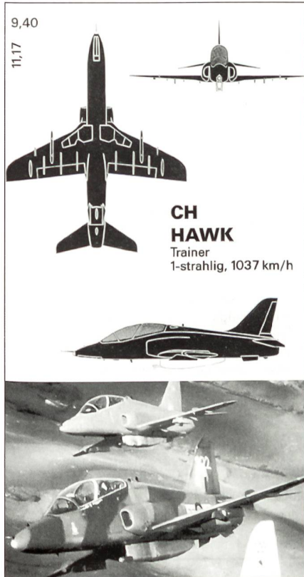
CH HAWK Trainer 1-strahlig, 1037 km/h