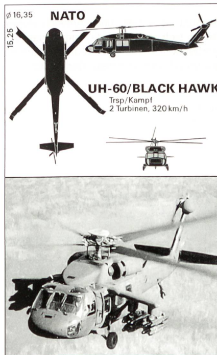
UH-60/BLACK HAWK Trsp/Kampf 2 Turbinen, 320 km/h