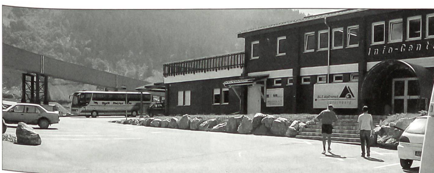
Infozentrum der NEAT-Baustelle «Mitholz» im Kandertal, Berner Oberland.

Nachdem alle wieder im «Dysli-Car» Platz genommen hatten, ging die Fahrt weiter über Adelboden zum Restaurant «Geils-Brüggli». Da ein