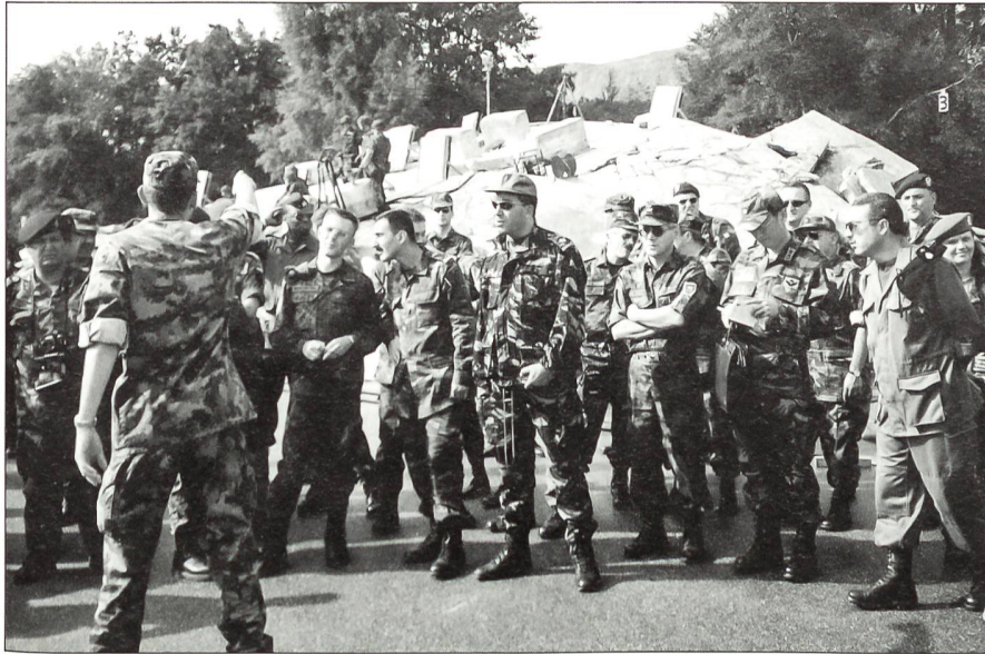
Ausländische Militärdelegationen bei der Information über die Arbeit der Rttg Trp.