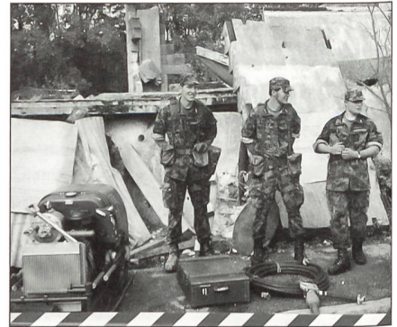
Rekruten beim Vorstellen ihrer Arbeitsplätze.

Punkt 14 Uhr eröffnete der Schulkommandant mit seiner Begrüssung den Besuchstag der Rettungs-Rekrutenschule 277. Zirka 1500 Eltern,