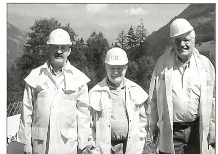
Alle Besucher wurden mit einer Schutzkleidung ausgerüstet.

Im Anschluss an diese interessante Information ging es in die Unterwelt, um das Gehörte und im Film vorgetragene an Ort und Stelle, das heisst möglichst live zu erleben. Vorerst wurden wir, wie es sich bei einem solchen Baustellenbesuch gehört, mit Helm und Schutzkleidung ausgerüstet. In Gruppen aufgeteilt, ging es danach mit Shuttlebussen in den Untergrund. Dass die Tunnelarbeiter bei viel Staub und recht hohen Temperaturen arbeiten müssen konnten wir live erleben. Einige Kameraden kamen recht ins Schwitzen. Auch der vorhandene dauernde Lärm darf nicht unterschätzt werden. Die Luft muss laufend umgewälzt bzw. erneuert werden, was den ständigen Betrieb einer ausreichenden Ventilation bedingt. Der Ausbruch des Felsmaterials bedingt einen Abtransport des Materials einerseits durch Förderbänder oder Transportfahrzeuge, die ebenfalls wieder einen recht grossen Lärm verursachen. In rund 1000 m unter Boden verliessen wir die Fahrzeuge, um per Fussmarsch einige interessante Arbeitsstellen