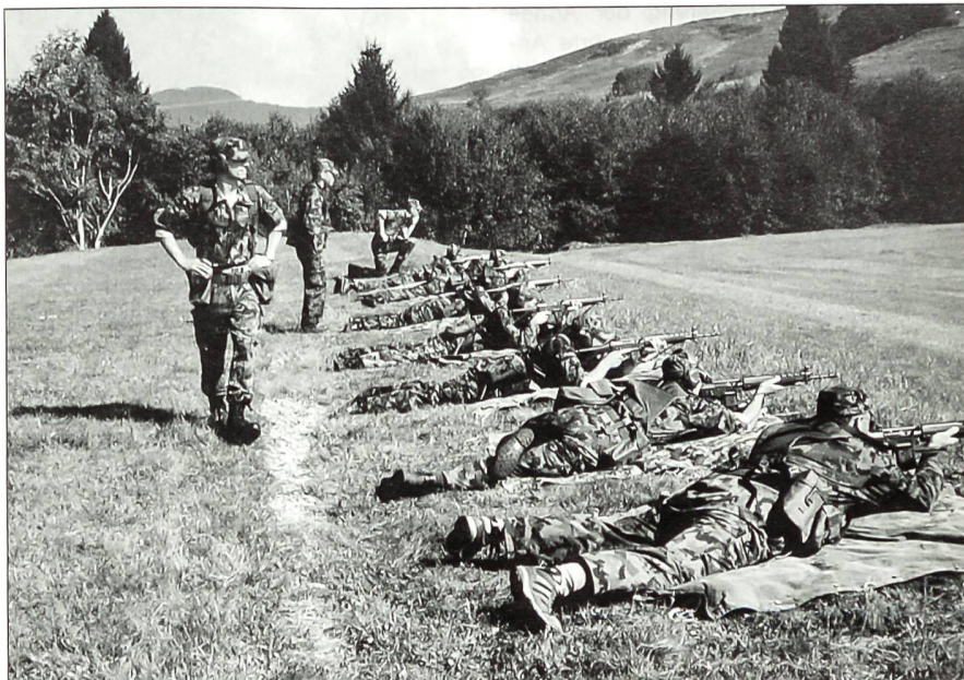
Eine Installationsgruppe des Mobilmachungsabschnitts 317.1 bei der infanteristischen Grundausbildung im WK 2000 auf dem Schiessplatz Rothenthurm-Altmett.

Stellvertretend für die Wehrmänner des Mobilmachungsplatzes 317 danke ich Ihnen, dass Sie unserer Einladung zur letzten Standartenabgabe unseres Verbandes gefolgt sind. Unser heutiges Zusammenkommen ist eine erinnerungsträchtige Begegnung, von Volk und Soldaten, eine