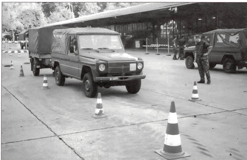
Manöver mit Puch samt Anhänger.

Die GMMB BM unterstützte dabei mit ihrem Einsatz im Rahmen der ausser-