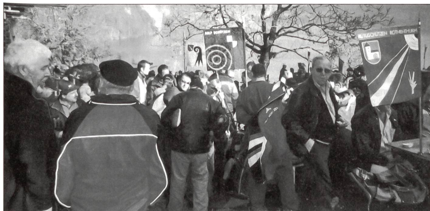
Kameradschaftliches Beisammensein unter den Schützen.

dem Karabiner in kniender Position ein möglichst gutes Resultat zu erzielen. Auch wenn am Ende nicht das Resultat erreicht wurde, das man sich vorgenommen hat, so darf doch jeder mit sich zufrieden sein. Nur schon dabei zu sein und in der Schiesslinie zu knien ist ein Erlebnis, das eben als Teilnehmer einer Gastsektion vielleicht nur einmal möglich ist.