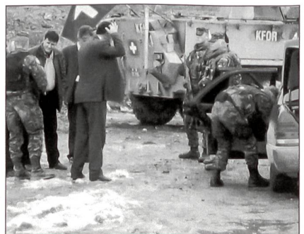
Kontrolle ziviler Fahrzeuge nach Waffen.

Die Landschaften sind an sich sehr schön, mit flachen Ebenen und sanften Hügeln und auch