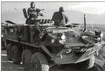
Unsere Füsiliere auf Patrouille. Nebst der persönlichen Waffe verfügen sie über die 12,7-mm-Bord-MG der Radschützenpanzer Piranha.

In den Schlussübungen wurde auch die situationgerechte Anwendung von Waffen, verbalen und nonverbalen Signalen zur Bereinigung von schwierigen Situationen trainiert. Dazwischen war noch eine Woche Fachausbildung angesagt.