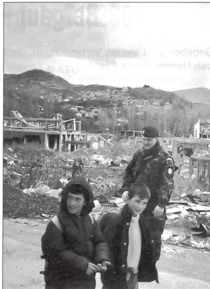
Zerstörte, noch nicht aufgebaute Siedlungen.

Grundsätzlich hat aber jedes SWISSCOY-Mitglied sein fachliches Rüstzeug aus dem militärischen und/oder beruflichen «Vorleben» mitzubringen. Damit kommt der Rekrutierung höchste Bedeutung zu!