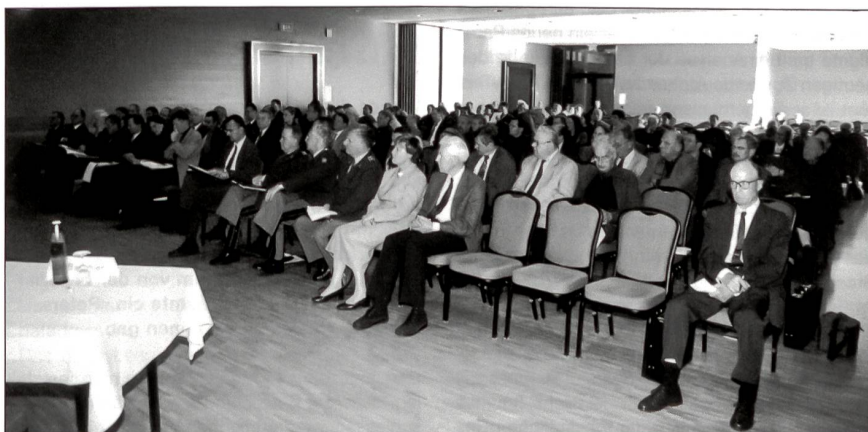
Kolloquium Sicherheitspolitik und Medien, Kursaal Bern.

Der Politologe Patrick Chabal, Professor am King's College in London, beleuchtete die «Chancen und Risiken einer Sicherheitspolitik» unter dem Titel «Afrikas Werden und die Risiken für Europa» und fragte zuerst, warum man denn überhaupt von Gefahren für Europa spreche. Er sieht die Gründe in der Furcht vor einer verstärkten Zuwanderung aus Afrika und all den Problemen, die daraus entstehen, vorab für ein Europa, dessen Völker je länger je mehr «Frem-