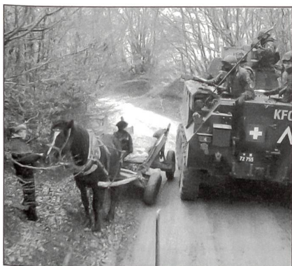
Zwei unterschiedliche Welten begegnen sich.

hohen Bergzügen. Vergleichbar mit unserem Tessin. Aber überall Müll und Umweltzerstörung als Zeichen der vernachlässigten öffentlichen Dienste! Das absolut Gefährlichste ist hier der Strassenverkehr: Aggressive Fahrer, klapprige Autos, schlechte Strassen! Zudem ist die Mìnengefahr (vor allem am Dulje-Pass) noch enorm. Und es werden ab und zu auch neue Minen gelegt ...!