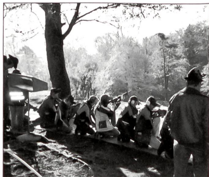
Stellung kniend in der Schützenlinie.

Neben den Rütli-sektionen aus der Urschweiz und den ständigen Gastsektionen werden alljährlich eine Anzahl nicht ständige Gastsektionen eingeladen. Dieses Jahr hatten auch die Schützen aus Belp im Kanton Bern das Glück, zu den ausgewählten Teilnehmern der nicht ständigen Gastsektionen zu gehören. Die Teilnahme an diesem Anlass ist für die Schiessenden nicht nur ein Ausflug aufs Rütli, sondern auch Verpflichtung. So wurden die Schützen intensiv darauf vorbereitet. Es ist nicht jedermanns Sache, mit einem Sturmgewehr oder auch mit