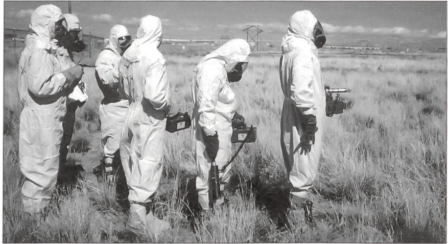
Spezialisten während einer Übung in den USA. Sie führen Messgeräte zur Messung von Alpha-, Beta- und Gamma-Strahlung mit sich.

Vor 28 Jahren bedrohte ein bis heute unbekannter Erpresser die an der Ostküste der Vereinigten Staaten gelegene Millionenstadt Boston. Er drohte mit der Zündung eines nuklearen Sprengsatzes, sollte er nicht 200 000 Dollar erhalten. Die US-Regierung reagierte sofort. Agenten des Federal Bureau of Investigation (FBI) sowie Wissenschaftler der Atomic Energy Commission wurden samt Spezialausrüstung in die Stadt eingeflogen und nahmen ihre Arbeit auf. Trotzdem war eigentlich keinem Regierungsvertreter klar, nach was und vor allem wo und wie der Sprengsatz gesucht werden sollte. Glücklicherweise stellte sich der Fall als Bluff heraus; das hinterlegte Geld wurde nicht abgeholt. Trotzdem zeigte der Zwischenfall, dass die USA gegen diese Art der Bedrohung nicht gewappnet waren. Daraufhin wurde 1975 auf Anordnung von US-Präsident Ford mit der Aufstellung des NEST (Nuclear Emergency Search Team) begonnen. Lange Zeit blieb diese Organisation vor den Augen der Öffentlichkeit verborgen. Erst Hollywood-Filme wie «Peacemaker» mit George Clooney als Army-Oberst und Nicole Kidman als Atomwissenschaftlerin der «Broken