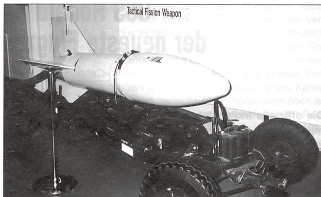
Zum Grössenvergleich: Nuklearbombe (Stand 2. Weltkrieg) ...