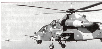
Denel Aviation AH-2A Rooivalk.

Die South African Air Force hat nach vielen Verzögerungen die beiden ersten einsatzbereiten Kampfhubschrauber vom Typ Denel Aviation AH-2A Rooivalk übernommen.