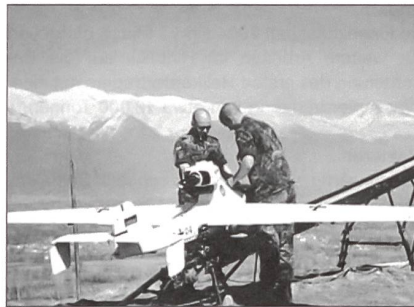
Bundeswehr setzt LUNA X-2000 ein: Das unbemannte Aufklärungsgerät LUNA vor dem Start.

Bei ihren Einsätzen im Kosovo und in Afghanistan setzt die Bundeswehr auch das Luftaufklärungssystem LUNA X-2000 (Luftgestütztes Unbemannte-Nahaufklärungs-Ausstattung) ein. Die Entwicklung dieses unbemannten Aufklärungssystems ging sehr rasch vor sich. Die Vorgaben der militärischen Führung lauteten vorerst, ein Aufklärungssystem für Panzeraufklärer bereitzustellen, das im Rahmen eines Spähtrupps einsetzbar, flexibel, leicht und schnell verlegbar sei. Daraus entwickelte man innerhalb von nur drei Jahren LUNA zur Serienreife. Diese kurze Entwicklungsdauer war nur möglich, weil man auf handelsübliche Bauteile zurückgegriffen hat. Bis auf wenige dieser Elemente, unter anderem das aus den USA stammende GPS, sind alle anderen Teile im Fachhandel frei erhältlich. Dies macht das System im