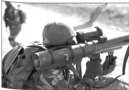
Französischer Fallschirmjäger der NRF im Einsatz.

An dem Manöver im türkischen Döğanyurt an der Ägäis beteiligen sich Luft-, See- und Landstreitkräfte aus elf Staaten. Französische Fallschirmjäger, spanische Marinesoldaten, türkische Spe-