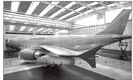
Ein Airbus A-310 als «Multi Role Transport Tanker» umgerüstet.

die volle Funktionalität eines strategischen Betankungsflugzeuges und können in der Luft bis zu 45 t Treibstoff abgeben. Alternativ ist eine Nutzung als Personentransport- und Frachtflugzeug oder als fliegendes Hospital möglich. Nun erfolgte das «Rollout» des ersten Flugzeuges. Unmittelbar auf das feierliche «Rollout» bei den Elbe Flugzeugwerken in Dresden folgt eine Testphase. Der Erstflug in Verantwortung der Luftwaffe ist für Mai vorgesehen. Bis August 2005 sollen alle vier Multi-Role-Maschinen für ihre neue zusätzliche Aufgabe umgerüstet sein. Mit der Umrüstung der A-310 ist ein Tankflugzeug entstanden, welches einer modernen Flugzeuggeneration angehört. Die verwendete Technologie kann als Grundlage für den Ersatz der