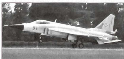
Prototyp Chengdu JF-17.

Gegenwärtig wird in der Volksrepublik China das Kampfflugzeug Chengdu FC-1/Super 7 erprobt. Pakistan, das sich ebenfalls an der Entwicklung beteiligt, hat einen Bedarf von 150 solcher Maschinen mit der neuen Bezeichnung Joint Fighter 17 (JF-17) Thunder angemeldet.