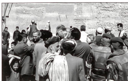
Sicherheit in Kabul: eine schwere Aufgabe für ISAF-Soldaten.

Norwegen ist bisher in zwei Operationen in Afghanistan und den anliegenden Gebieten involviert: Neben der Teilnahme an der ISAF-Truppe, die eine Stabilisierung der Lage in und un-