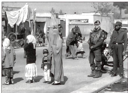
Bundesheer-Patrouille in Afghanistan: Keine Truppen mehr für ISAF, dafür aber Stabsoffiziere.

Es ist beabsichtigt, im Jahr 2004 deutlich mehr Soldaten in Krisengebiete, insbesondere nach Südosteuropa, zu entsenden. Neben der Weiterführung des Einsatzes im Kosovo und einer Beteiligung an der für 2004 vorgesehenen EU-Mission in Bosnien plant Platter, bis zu zehn Stabsoffiziere nach Afghanistan zu entsenden. Einen besonderen Schwerpunkt legt man dabei auf die Ausrüstung und den Schutz der Soldaten im Ausland: «Ich schicke keinen Soldaten ins Ausland, der nicht bestens ausgerüstet ist», erklärte der Minister. Er werde die Internationalisierung des Österreichischen Bundesheeres