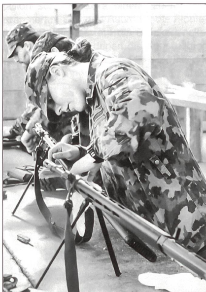
Bei der Waffenreinigung am Stgw 90.

Beim Sporttest gibt es für Frauen nach wie vor spezielle Leistungsnormen, welche je nach Einteilung in eine Funktion variieren. Dabei wird einerseits der Tatsache, dass Frauen über ca. 15% weniger Körperkraft verfügen, andererseits aber auch dem Umstand, dass während der Dienstleistungen an die Frauen die gleichen körperlichen Anforderungen gestellt werden, Rechnung