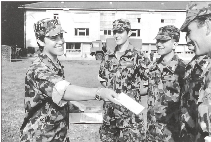
Frauen in der Armee: Weiblicher Leutnant mit drei männlichen Offiziersanwärtern in der Log OS in Bern.

Durch die Armee XXI werden künftig die jungen Frauen insgesamt zweimal direkt angesprochen. Mit 16 Jahren wird nämlich allen jungen Schweizerinnen und Schweizern eine erste Information über Sicherheitspolitik und deren Instrumente zugesandt. Darin ist darauf hingewiesen, dass die gesamte Bevölkerung von Notsituationen gleichermassen betroffen ist und dass Frauen in allen Institutionen der Sicherheitspolitik mitmachen können. Mit 18 Jahren werden dann alle Frauen zum für die gleichaltrigen Männer obligatorischen Orientierungstag eingeladen. Dort werden sie vor allem über die Armee und den Zivil-