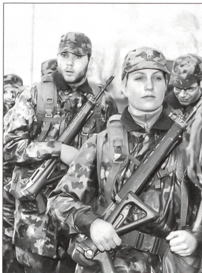
Auf dem Marsch.

eine Frau sieht, dass sie während längerer Zeit keinen Dienst mehr machen kann, kann sie dies der zuständigen Stelle melden. Es wird dann versucht, mit ihr eine Lösung zu finden, und zwar durch Umteilung in die Ausbildungsgefässe «Ausbildung und Support» der Lehrverbände oder in die Reserve der Dienststelle FDA. So wird der Betroffenen ermöglicht, massgeschneidert und nach Absprache kürzere oder längere Dienste zu leisten. Familienpflichten entbinden also nicht mehr von der Dienstleistungspflicht. Wenn dann eine Frau während drei Jahren nicht mehr Dienst geleistet hat, wird sie befragt, ob sie in absehbarer Zeit wieder Dienst leisten könne. Ziel ist, sie entweder wieder in die Einsatzarmee einzuteilen, sie für bestimmte Zeit in einem Reservegefäss zu belassen oder sie bei Unmöglichkeit der