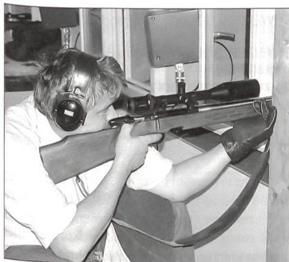
Im Erdgeschoss schiessen Jäger auf Distanzen von 150 und 100 Metern.

rege und erfolgreich benützt worden. Die Weltneuheit «Brünig Indoor» ist ein Kompetenzzentrum für alle Schützen. Die Idee, lärmfrei zu schiessen, ist nicht neu. Schiesszeiten werden an vielen Orten eingeschränkt, aus verschiedenen Gründen (z.B. Bundesgesetz über den Umweltschutz und Lärmschutzverordnung) mussten in den letzten Jahren massenhaft Anlagen geschlossen werden, einige konnten mit grossen Investitionen den neuen