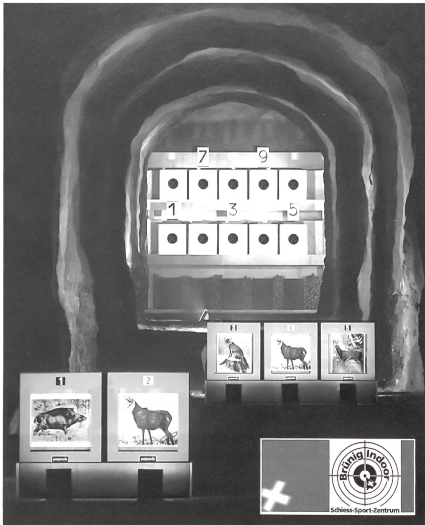
Blick in den imposanten 300-, 150- und 100-m-Schiesskanal.

gesetzlichen Rahmenbedingungen angepasst werden. Per Saldo bleibt aber eine Abnahme der Schiessgelegenheiten in der ganzen Schweiz.