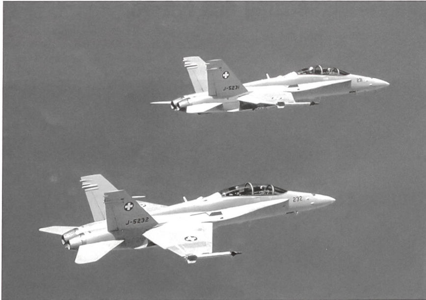
Der F/A-18 Hornet bildet das fliegende Rückgrat der Schweizer Luftwaffe.

beiden Flugzeugtypen zu gewährleisten, ferner - verbesserte Leistungen der bewährten Systeme und Waffen der Hornet, - noch höhere Leistungsfähigkeit und Zuverlässigkeit des neuen Flugzeugtyps, - noch flexiblere Anpassungsfähigkeit an neue Bedürfnisse und grosses Wachstumspotenzial dank besseren Platz- und Kapazitätsreserven zu schaffen.