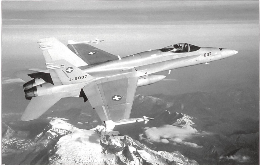
F/A-18 C/D Hornet patrouillierten zum Schutz des G8-Gipfels in Evian mit Kriegsbewaffnung über den Alpen.

Sicher kann die Schweiz heute keine eigenen Kampfflugzeuge mehr entwickeln