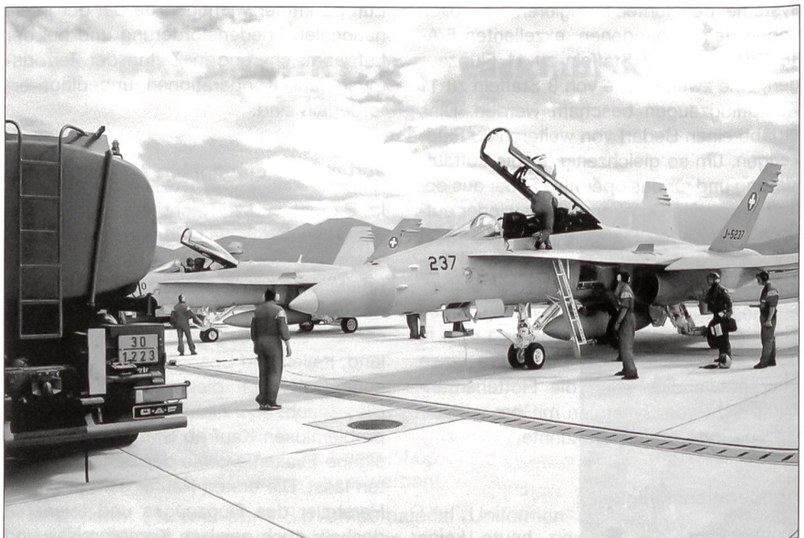
Eine wichtige Funktion zum Gelingen des Flugs hat das Bodenpersonal.

Dies würde zudem nach dem Slogan «Do not buy American» riechen, was unfair wäre, da die USA neben der EU unsere wichtigsten Exportkunden sind. ☒