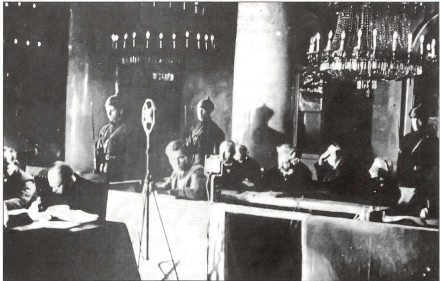
Schon im Jahre 1930 kam es zu einem Schauprozess gegen acht Mitglieder der so genannten «Industriepartei», denen Sabotage vorgeworfen wurde.