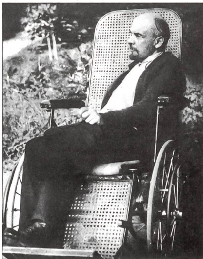
Lenin im Rollstuhl. Eine der letzten Aufnahmen.

Das alleinige Beweismaterial waren die Geständnisse. Durch Folter und Dauerverhöre wurde jede gewünschte Selbstanschuldigung der Angeklagten erzielt. Man muss nicht Schreckensbilder des Mittelalters in den Kinderbüchern des Geschichtsunterrichts der Volksschulen anschauen, um davon einen Begriff zu be-