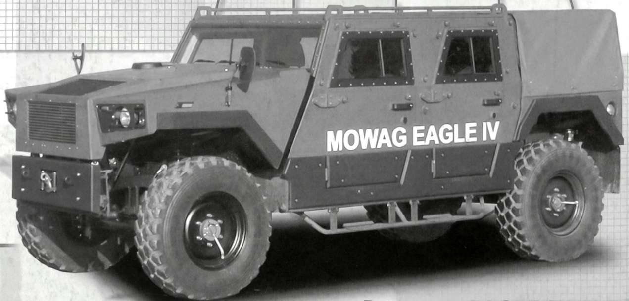
Der neue EAGLE IV 4x4

Die neu entwickelten MOWAG EAGLE IV und DURO III P bieten äusserst wirkungsvollen Ballistik- und Minenschutz bei geringem Gewicht sowie eine sehr hohe Gelände- und Strassenmobilität. Daraus resultiert eine grösstmögliche Sicherheit für Besatzung und Mannschaft.