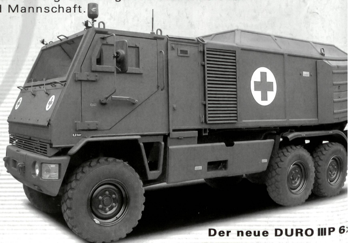
Der neue DURO III P 6x6

Die neu entwickelten MOWAG EAGLE IV und DURO III P bieten äusserst wirkungsvollen Ballistik- und Minenschutz bei geringem Gewicht sowie eine sehr hohe Gelände- und Strassenmobilität. Daraus resultiert eine grösstmögliche Sicherheit für Besatzung und Mannschaft.