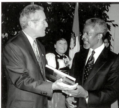
Würdigung der vielfältigen internationalen Aktivitäten: UN-Generalsekretär Kofi Annan zu Besuch im LABOR SPIEZ.

Auch für die neutrale Schweiz ist die internationale Zusammenarbeit in sicherheitspolitischen Fragen in den letzten Jahren immer wichtiger geworden. Im Auftrag des Bundes leistet das LABOR SPIEZ durch gezielte Massnahmen in Krisenregionen einen Beitrag zur globalen Friedenssicherung und zur Konfliktbewältigung. Es stellt sein Fachwissen in den Dienst von verschiedenen internationalen Organisationen. Die UNO, die Organisation für das Verbot chemischer Waffen (OPCW), die UN-Umweltschutzorganisation (UNEP), die Internationale Atomenergieagentur (IAEA), die Weltgesundheitsorganisation (WHO), aber auch das NATO-Programm Partnerschaft für den Frieden (PfP) sind zu wichtigen Partnern geworden. Im Rahmen von verschiedenen Missionen führten Mitarbeiter des LABOR SPIEZ zwischen 1999 und 2002 auf dem Balkan und im Nahen Osten umfangreiche Analysen über die Gefährdung der Bevölkerung durch verschossene Munition aus abgereichertem Uran durch. Im Auftrag der UNEP war eine Spezialistin 2002 an der Überprüfung der Trinkwasserqualität in Afgha-