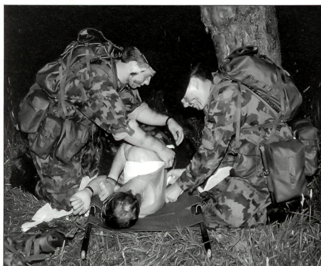
Die Sanitätsausbildung in der AGA hat einen höheren Stellenwert als bisher.

Die Ausbildung zum Zugführer (Zfhr) verläuft zuerst parallel zur Ausbildung des Grfhr. Während der Anw S bietet das System auch eine gewisse Durchlässigkeit. Dies bedeutet, dass ein Of Anw bei Nichtgenügen in die Laufbahn des Grfhr zurückgestuft werden kann. Es bedeutet aber auch, dass ein Uof Anw bei entsprechen-