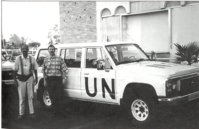
Im Dienste der Abrüstung: In den 1990er-Jahren waren Experten des LABOR SPIEZ an den Waffeninspektionen im Irak beteiligt.