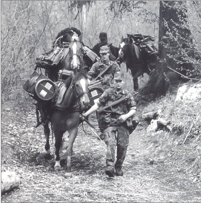
Im zweiten Teil der RS (FGA) lernt der Rekrut seine Funktion in der Truppe kennen.

der Leistung und Potenzial auch in die Offizierslaufbahn wechseln kann.