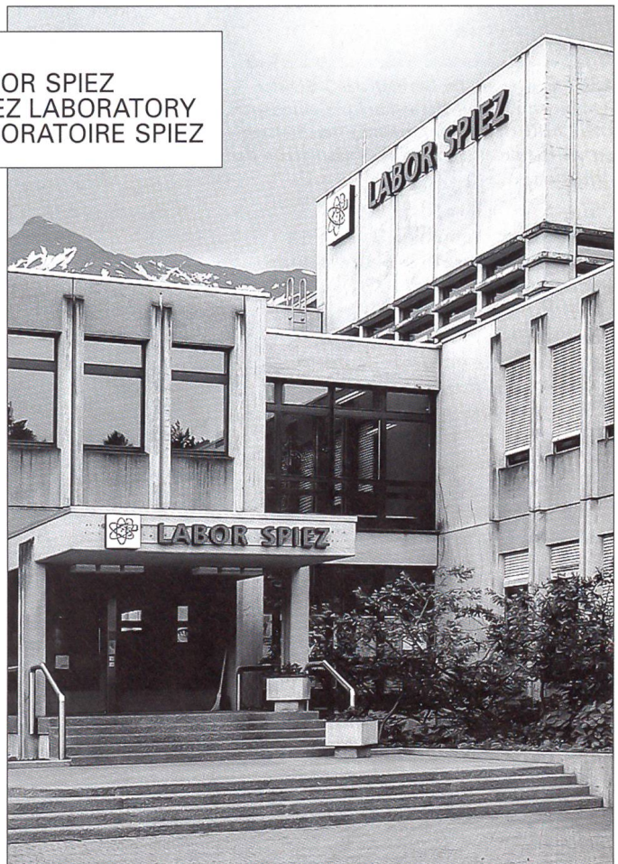
Das LABOR SPIEZ verfügt über ein modernes und zweckmässiges Gebäude.