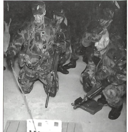
VBA – Befehlsausgabe am Geländemodell.

Natürlich gehört auch die richtige Portion Sport zur militärischen Grundausbildung. Im Vergleich zur Ausbildung in der RS der Armee 95 wurde die Ausbildung im Sanitätsdienst massiv erweitert. Die Rekruten absolvieren eine Ausbildung, die in etwa jener der früheren Zugsanitäter entspricht.