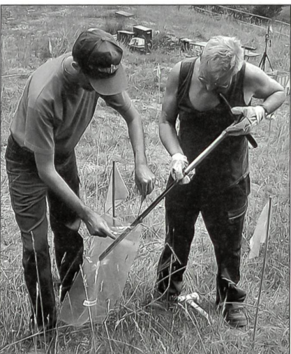
Das Fachwissen im Bereich ABC-Schutz wird auch für den Umweltschutz eingesetzt. Das LABOR SPIEZ untersucht beispielsweise die Bleibelastung auf Schiessplätzen der Armee.