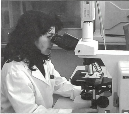
Das LABOR SPIEZ reagiert auf neue Bedrohungen: Das Fachwissen über Bedrohungen durch biologische Kampfstoffe wird ausgebaut.