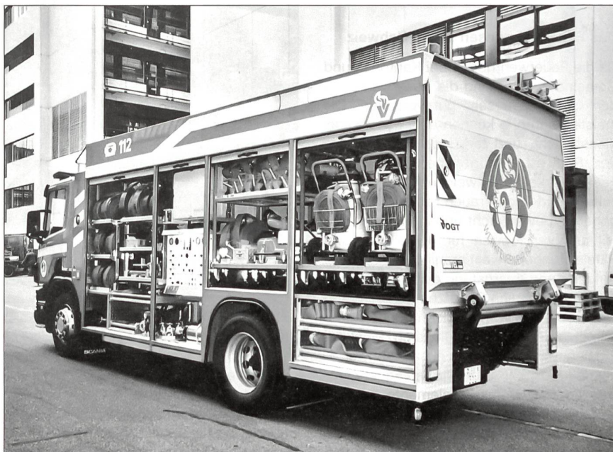
Ausbildung und Ausrüstung ergänzen sich und machen die Feuerwehren nicht nur bei Brandfällen zu einem unverzichtbaren Ersteinsatzelement.

Die Feuerwehren sind im Gesamtkonzept Bevölkerungsschutz von zentraler Bedeutung, dies umso mehr, als die Bezeichnung Feuerwehr das Aufgabengebiet dieser wichtigen Organisation nur noch unzulänglich umschreibt.