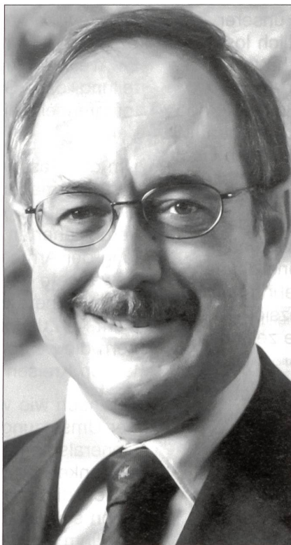
Bundesrat Samuel Schmid, Chef des Eidgenössischen Departementes für Verteidigung, Bevölkerungsschutz und Sport.

Der Bericht äussert sich auch zu den Problemen in den Lehrverbänden, dies nachdem unter dem Spardruck der Aufwuchs beim militärischen Berufspersonal gestoppt werden musste und für die Grundausbildung auf Milizkader der A 95 im WK-Rhythmus zurückgegriffen werden musste.