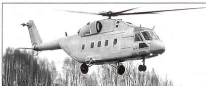
Mi-38 beim Erstflug am 22.12.03

Als möglicher Nachfolger der Typen Mil Mi-8 und Mi-17 Hip wurde seit 1983 der russische Mehrzweckhubschrauber Euromil Mi-38 entwickelt. Vorerst sind Triebwerke von Pratt & Whitney Canada eingebaut.