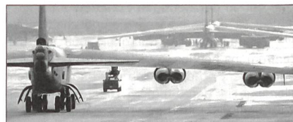
B-52H auf Anderson Air Force Base, Guam

Künftig sollen dauernd Rotations-Detachemente schwerer Langstreckenbomber der Typen Boeing B-52H Stratofortress, Rockwell B-1B Lancer oder Northrop B-2 Spirit auf der Pazifikinsel Guam stationiert werden.