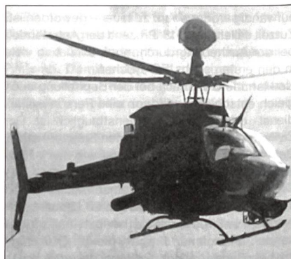
OH-58D Kiowa Warrior

Das 39-Mia.-Dollar-Projekt eines künftigen leichten Stealth-Mehrzweckhubschraubers RAH-66