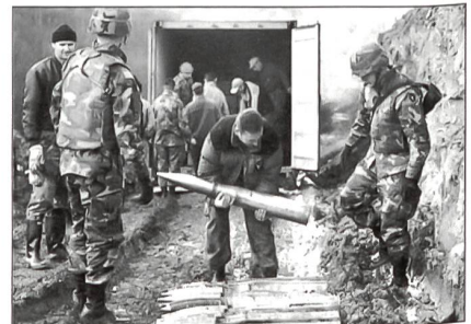
SFOR-Soldaten helfen die zahlreichen Überbestände an Munition zu beseitigen.

Die Europäische Union wird das Kommando über die Stabilisation Force (SFOR)-Truppen in Bosnien-Herzegowina übernehmen. Dieses Vorgehen ist zur Entlastung der NATO und zur Stärkung der strategisch-operativen Fähigkeit im militärischen Bereich der EU beabsichtigt. Es ist auch offensichtlich, dass sich die USA mit ihren Kräften aus der SFOR verabschieden und diesen Krisenbereich der EU überlassen wollen. Der Plan für diesen Kommandowechsel war schon längere Zeit bekannt und sollte gegen Ende des Jahres 2004 realisiert werden. Wie aus diplomatischen Kreisen zu vernehmen ist, soll