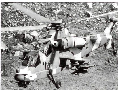
Südafrikanische AH-2A Rooivalk

Die südafrikanischen Streitkräfte erhalten in den nächsten drei Jahren eine unbekannte Anzahl von Kampfhubschraubern des Typs Denel AH-2A Rooivalk.