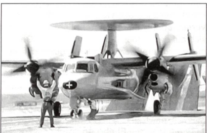
Hawkeye der Aéronavale

Northrop Grumman lieferte das dritte Führungs- und Kontrollflugzeug E-2C Hawkeye an die französische Flotte. Diese hochkomplexen AWACS sind Bestandteil der Ausrüstung des Flugzeugträgers «Charles de Gaulle».