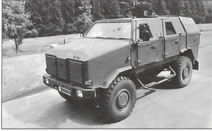
Geschützte Fahrzeuge wie der «Dingo 2» werden gekauft.

60 Transportflugzeuge vom Typ A 400 M, 152 Transporthubschrauber der Typen NH 90 und MH 90 sowie Verbesserungen der derzeit eingesetzten Transporthubschrauber CH 53 schaffen.