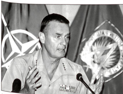
US-General James Jones, Befehlshaber von ACO.