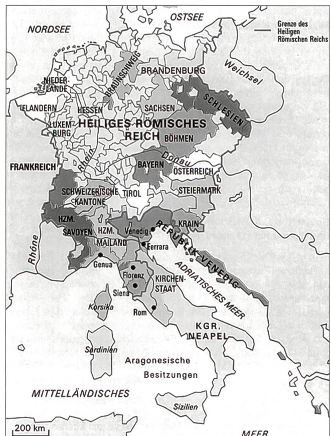
Das Heilige Römische Reich und Italien im 15. Jahrhundert.

In einem Aufruf an die Reichsstände schilderte er zunächst das Werden der Eidgenossenschaft: Drei Orte hätten sich gegen ihren rechten, natürlichen Fürsten, den Herzog von Österreich erhoben. Verbun-