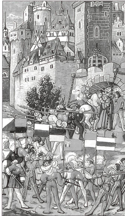
Empfang von Schweizer Söldnern durch den König von Frankreich.

Maximilian verhielt sich strategisch unklug. Statt seine Kräfte zu einem Schwerpunkt zu bündeln, verzettelte er sich in einer Reihe von Einzelaktionen. Dies ermöglichte den Eidgenossen, ihr Verteidigungsdispositiv und die Garnisonen in Sargans, im Rheintal, im Thurgau und in Baden zu verstärken. Im Osten verteidigten sich die Bündner erfolgreich im Münstertal (an der Calven) und im vorarlbergischen Frastanz. Im Norden kämpften die Eidgenossen siegreich gegen den Schwäbischen Bund vor den Toren der Stadt Konstanz (bei Schwaderloh), im Hegau und auf dem Bruderholz in Basel. Der Ausgang der Schlacht bei Dornach endlich überzeugte Maximilian von der Sinnlosigkeit weiteren Blutvergiessens. Der Frieden von Basel am 22.9.1499, vermittelt durch den Herzog von Mailand, der auf eidgenössische Hilfe zur Rückeroberung seines Herzogtums hoffte, und befördert durch den König Lud-