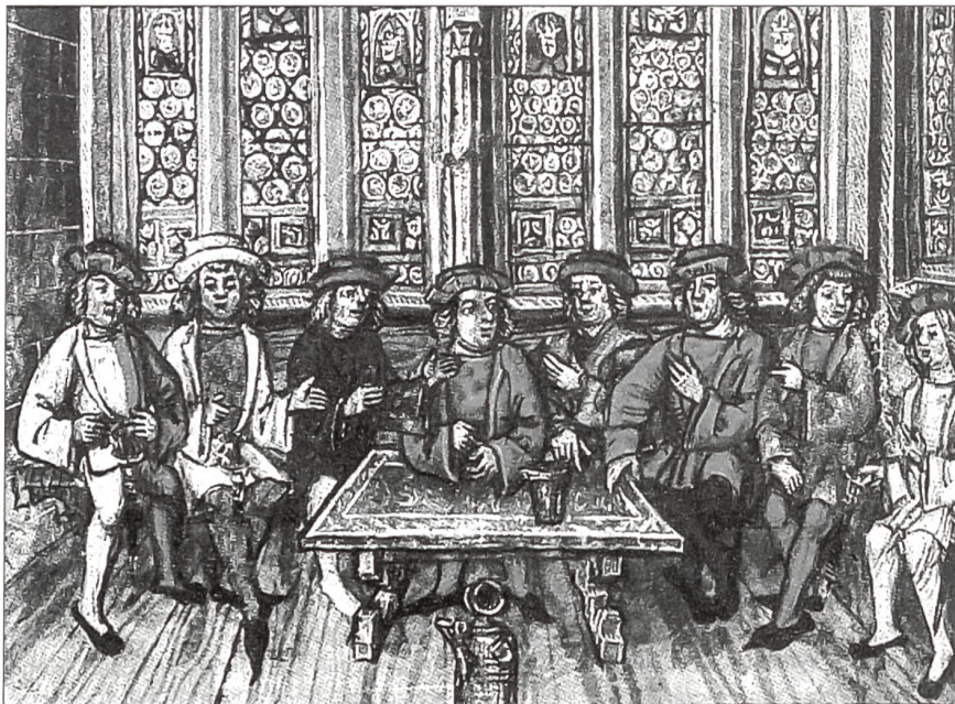
Die Acht Orte beraten in Stans NW über den Bund mit Freiburg und Solothurn (Luzerner Chronik des Diebold Schilling, 1513).

den durch unchristliche Eide hätten sie ihre Nachbarn zum Abfall genötigt. Weiter führte er aus, es wäre «eine Schande für das Reich, wenn den bösen, groben und schnöden Bauersleuten, in denen ja keine Tugend, kein adelig Geblüt, keine Mässigung herrscht, sondern allein Üppigkeit, Untreue, Hass der deutschen Nation, ihrer rechten, natürlichen Herrschaft, nicht gewehrt würde». Er plante eine Reihe militärischer Strafexpeditionen, verteilt auf die ganze Nordostgrenze der Eidgenossenschaft, beginnend im bündnerischen Münsental und endend am Rheinknie in Basel. Deren Durchführung übertrug er dem Bund der schwäbischen Fürsten, Ritter und Stände sowie dem österreich-tirolischen Adel. Damit zwang er die Eidgenossenschaft, die Grenze an den strategisch wichtigen Übergängen und Einfallachsen durch stehende Garnisonen zu schützen. Es kam so zu einer ersten Art von Grenzbesetzung in der Geschichte des Landes.