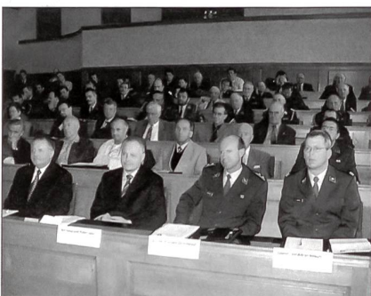
Interessierte Ehrengäste aus Politik und Militär.