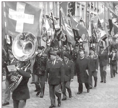
Mit einem Umzug durch die Stadt Bern wurde die DV im Rathaus Bern abgeschlossen.

Da der SUOV für die Jahre 2004 und 2005 das Präsidium der AESOR übernommen hat, mussten verschiedene Vorbereitungen für den Kon-