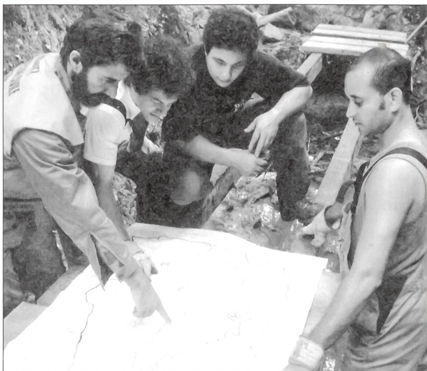
Blick auf die Karte: Die bisher eigenständigen ZS-Regionen Hinterland, Herisau, Mittelland, Vorderland werden aufgehoben.