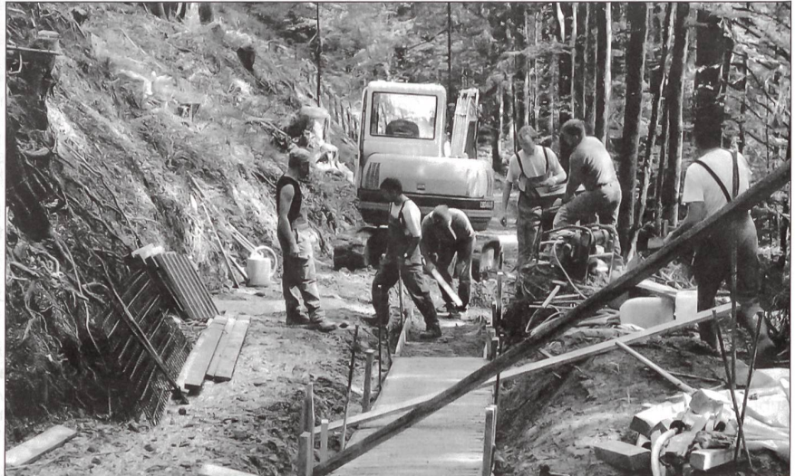
Mit dem Einbau einer Fahrrinne im steilsten Stück zur Wideregg wird das Befahren auch bei schlechtem Wetter sicherer.

Die sicherheitspolitische Lage hat sich im letzten Jahrzehnt gewandelt. Der Zivilschutz richtet sich deshalb (als Partnerorganisation im Bevölkerungsschutz) primär aus auf die Bewältigung von Katastrophen