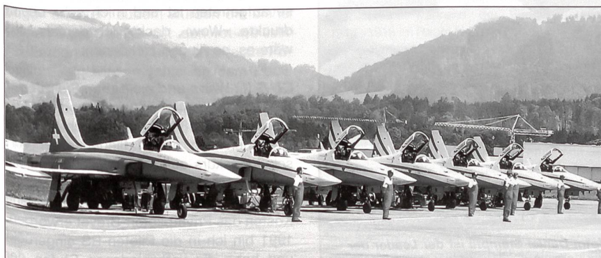
Die Bodencrew der PS sorgt dafür, dass die Flugzeuge immer startklar sind.

Das Kunstflugteam der Schweizer Luftwaffe hat sich seit der Gründung kontinuierlich entwickelt und wurde rasch zum Liebling bei den Flugveranstaltungen. Im Jahre 1970 erhielt die Patrouille Suisse