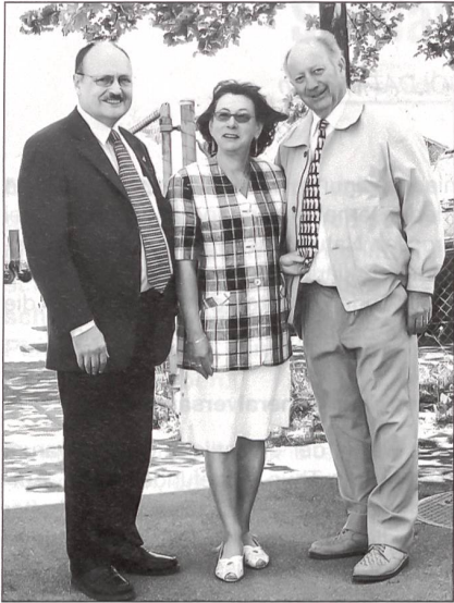
Neue Sekretärin im Team.