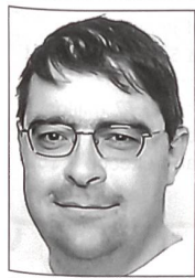
Fach Of Fabian Coulot, Basel

Landesteil stimmten dagegen 64,9 Prozent für die Wiedervereinigung. Für einen Erfolg des Referendums wäre die Zustimmung beider Volksgruppen nötig gewesen. Daher dürfte faktisch nur der griechische Landesteil der Europäischen Union beitreten. Der Plan von UNO-Generalsekretär Annan sah die Schaffung einer Föderation zweier Teilstaaten nach dem Muster der Schweiz vor.