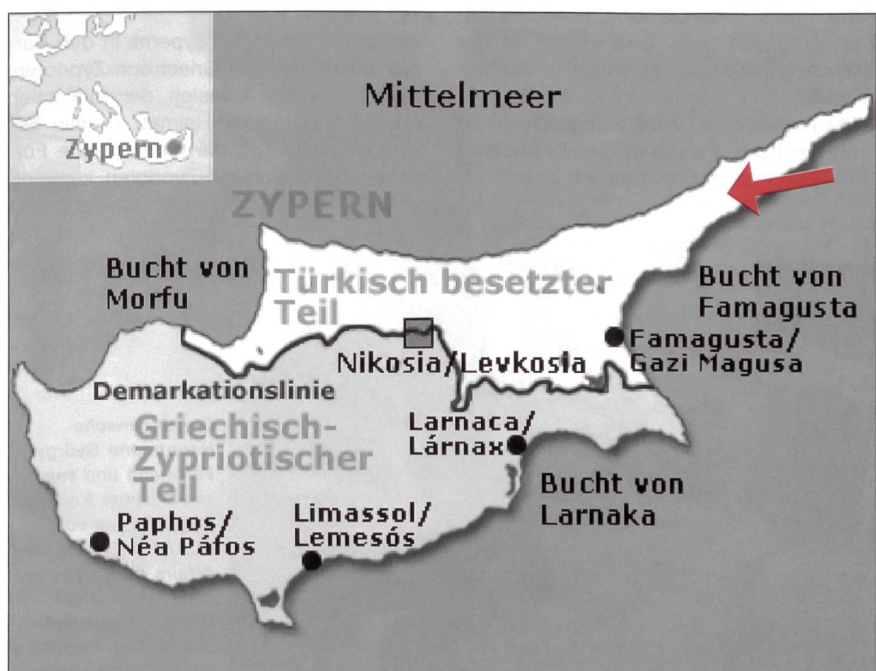
Karpas: Die Enklave der Griechisch-Zyprioten im besetzten Norden.

Griechenland, die Türkei und Grossbritannien sollten die Unabhängigkeit Zyperns garantieren. Die eigentlich Betroffenen, die