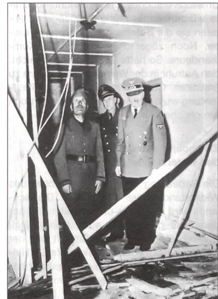
Besichtigung: Hitler lebt. Er demonstriert dem Nachmittagsgast Mussolini (links) den Ort des Geschehens.

Am Morgen des 20. Juli 1944 landeten Stauffenberg, sein Adjutant Oberleutnant von Haeften und Generalmajor Stieff im ostpreussischen Rastenburg nahe beim Führerhauptquartier, der Wolfsschanze. Von Haeften trug die Mappe mit dem Sprengstoff. Kurz vor der Lagebesprechung wurde der Zeitzylinder mit einer Flachzange in einem Nebenzimmer eingedrückt. Die Laufzeit wurde auf 15 Minuten eingestellt. An der Seite eines Adjutanten Keitels ging Stauffenberg sofort zu Hitler hinein, der ihn begrüusste. Indessen referierte Generalleutnant Heusinger. In einer Reihe am Tisch, auf dem eine Karte ausgebreitet war, standen Stauffenberg, Heusinger und Hitler. Stauffenberg platzierte die Mappe mit der Bombe direkt unter dem Tisch Hitler zu Füssen. Hierauf verliess Stauffenberg den Raum. Nach wenigen Minuten erfolgte eine furchtbare Detonation. Stauffenberg schlug mit Haeften unverzüglich den Weg zum Flugplatz ein. Beim ersten Sperrgürtel konnte ihr Wagen noch passieren, weil der Alarm eineinhalb Minuten später erfolgte. Am Aussengürtel jedoch verwies der wachhabende Feldweibel bereits auf die inzwischen ausgelöste Sperre. Mit einem Bluff konnte Stauffenberg die Wache überrumpeln und durchfahren. Stauffenbergs Flugzeug startete sofort.