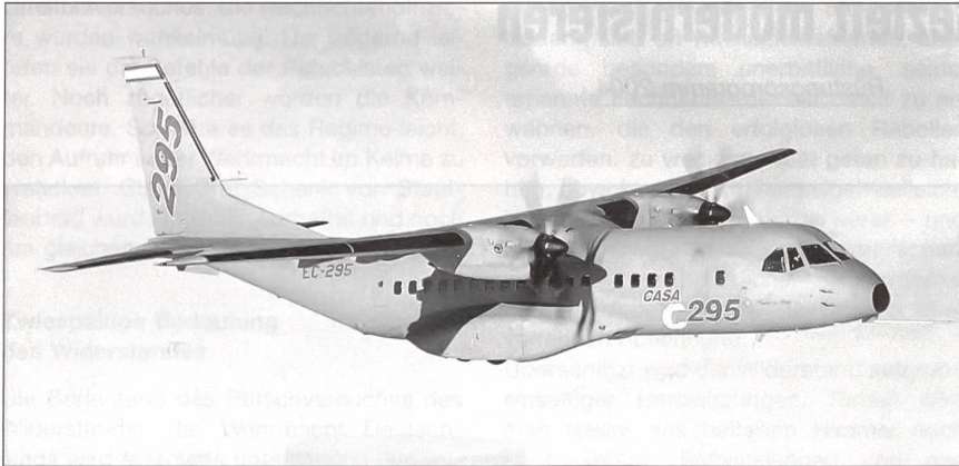
Das bewährte spanische Transportflugzeug CASA C-295M erlaubt mit moderner Avionik militärische und zivile Einsätze.

Inland sichergestellt werden. Die CASA ist ein erprobtes Flugzeug. Sie bietet Platz für 66 Passagiere oder für rund neun Tonnen Fracht. Für medizinische Evakuationen können 24 Tragbahnen installiert werden. Die Maschine ist mit einer modernen Avionik ausgerüstet, die militärische und zivile Einsätze erlaubt. Der Rüstungschef, Dr. Alfred Markwalder, betont, dass der Kauf der zwei beantragten Transportflugzeuge markant günstiger ist als eine Miet- oder Leasing-Lösung. Der Chef der Armee will die zwei CASA in die in Eindhoven gegründete europäische Lufttransport-Koordinationszelle einbringen. Der Zweck dieser Organisation ist es, die Transportkapazität verschiedener europäischer Luftwaffen optimal zu nutzen. Das heisst für unser Land, dass in Zeiten bedeutender Transportbedürfnisse der Einsatz einer grösseren Flugzeugkategorie, z. B. C-130 Hercules, angefordert werden kann. Die Lieferfrist für die beiden Maschinen beträgt rund eineinhalb Jahre. Der Flugbetrieb kann in der zweiten Hälfte 2006 aufgenommen werden.