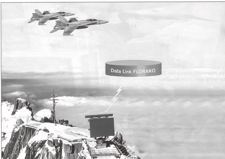
Dank Data Link FLORAKO: Schneller und sicherer digitaler Datenaustausch zwischen Bodenstation und Kampfflugzeug.

Auf verschiedenen Höhenstandorten werden Einrichtungen für den Data Link installiert. Das Kernstück dieser Bodenstationen bildet das MIDS-Terminal (Multi Information Distribution System Terminal). Das Terminal kann technische und taktische Daten von und zu den F/A-18 verschlüsselt und störsicher übertragen. Die Ablieferung des neuen Materials an die Luftwaffe und die Erweiterung im FLORAKO-System sind für die Jahre 2006 bis 2009 vorgesehen.