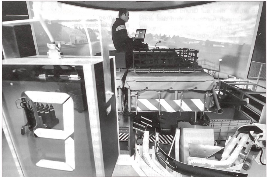
Die neue Schiessausbildungsanlage für Panzerhaubitzen in Bière (VD) konnte der Schweizer Armee planmässig übergeben werden.

Beschäftigt wurden im Jahresdurchschnitt 5665 Mitarbeitende (4544). Die Zahl der Auszubildenden konnte in der Schweiz mit 400 angehenden Berufsleuten auf einem vergleichsweise hohen Niveau gehalten werden.