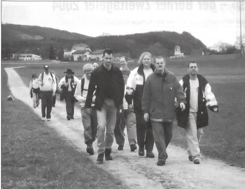
MSV Sektion Winterthur unterwegs.