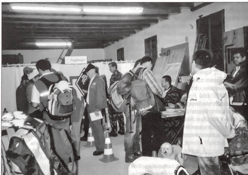
Hochbetrieb im Posten Start und Ziel.

236 Teilnehmer nahmen die Gelegenheit wahr, das neue Angebot des Sternmarsches zu erleben. Dies darf als Erfolg gewertet werden. Über insgesamt 205 km können Strecken zwischen 3 km und 26 km absolviert werden. An neun Kontrollposten wird das Kontrollblatt gestempelt, und es besteht auch die Möglichkeit, eine Pause zu machen mit Verpflegung. Ganz neu im Angebot steht die Möglichkeit, mit