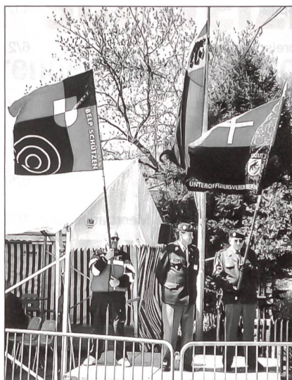
Das «offizielle» Empfangskomitee mit den Fahnen der Schützen Belp und des UOV Bern.

Neben dem Gemeindepräsidenten von Belp, Nationalrat Rudolf Joder Präsident der Schweizerischen Unteroffiziersgesellschaft SUG), Vertretern von Bundesparlament, Kantons- und verschiedenen Gemeindebehörden sowie hohen Militärs aus