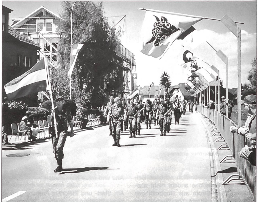
Stolzes Detachement der holländischen Armee.

Gruppe des Bundesgrenzschutzes aus Rostock (Deutschland) wäre gerne in die Schweiz gereist. Aber durch das Engagement wegen erhöhter Sicherheitsmassnahmen auf Grund von Terrorbefürchtungen und verstärkten Grenzkontrollen konnten einige Armeen (Einsatz Irak und Afghanistan) und Grenzwachtkorps nur kleinere Kontingente delegieren. Auch die neuen Ausbildungsformen bei der Schweizer Armee (verkleinerte Armee XXI) zeigte Wirkung. Alle, die nach Belp pilgerten, waren aber glücklich, die geforderten Strecken geschafft zu haben. Obwohl in der Schweiz am feierlichen Einmarsch am Sonntag bei der Mühlestrasse in Belp nicht Tausende von begeisterten Zuschauern anwesend waren, wie dies jeweils am Internationalen Vier-Tage-Marsch von Nijmegen/Holland der Fall ist, rafften sich die An-