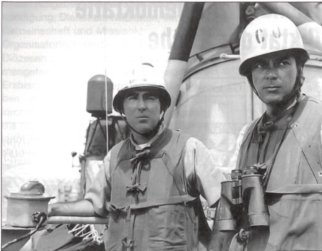
Der Kommandant der «USS Maddox», Fregattenkapitän Ogier (rechts), und der Kommandant des Zerstörerverbandes, Kapitän zur See Herrick, an Bord der «USS Maddox». Sie waren die unmittelbaren Betroffenen der Gefechte vom 2. und 4. August 1964 im Golf von Tonkin, die in der Folge zum verstärkten US-Engagement und zum Vietnamkrieg führen sollten.

Zurückschlagung bewaffneter Angriffe gegen die Streitkräfte der USA und zur Verhinderung weiterer Aggression» zu unternehmen. Dies sollte eine für den weiteren Konfliktverlauf in Vietnam äusserst folgenschwere Entscheidung werden.