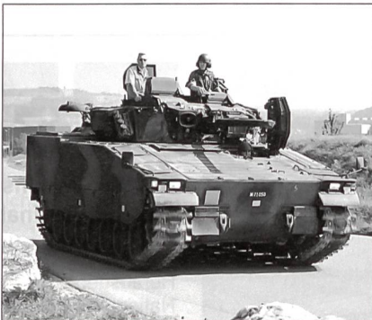
Info-Teilnehmer mit dem Schützenpanzer 2000 auf Probefahrt.

nikerschule ihre Rekruten auch noch an vielen anderen Objekten aus. Grundsätzlich müssen für alle in der Armee vorhandenen Objekte Truppenhandwerker ausgebildet werden.