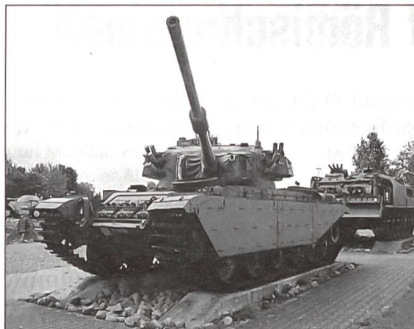
Auch die Pz-Haubitze gehört zum Ausbildungsprogramm der Panzermechaniker.

Im Weiteren konnten wir feststellen, dass der Schützenpanzer 2000 ebenfalls mit den modernsten Anlagen ausgerüstet ist. Über einen Bordcomputer ist es dem Panzerkdt möglich, die ganze Arbeit seiner Mannschaft zu kontrollieren und notfalls zu korrigieren. Neben dem Schützenpanzer 2000 bildet die Panzermecha-