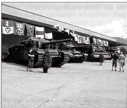
Aufstellung verschiedener Panzertypen für den Besuchstag.