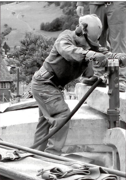
Eindringen in Trümmer.