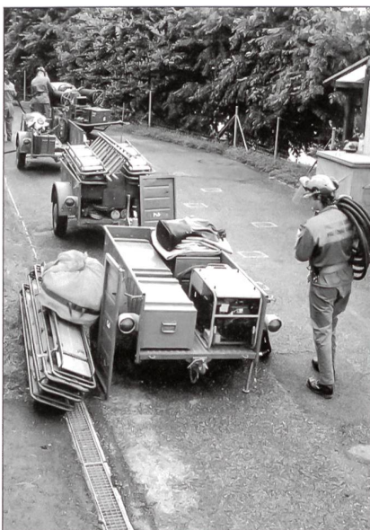
Letzte Vorbereitung für den Einsatz.

Das Gefährdungspotenzial, ausgehend vom Transport gefährlicher Güter auf der Schiene, der Strasse und dem Rhein, konzentriert sich auf die Gebiete mit hoher Bevölkerungsdichte im Bezirk Arlesheim und im Bezirk Liestal sowie entlang der Nord-Süd-Strecken Basel-Olten / Egerkingen