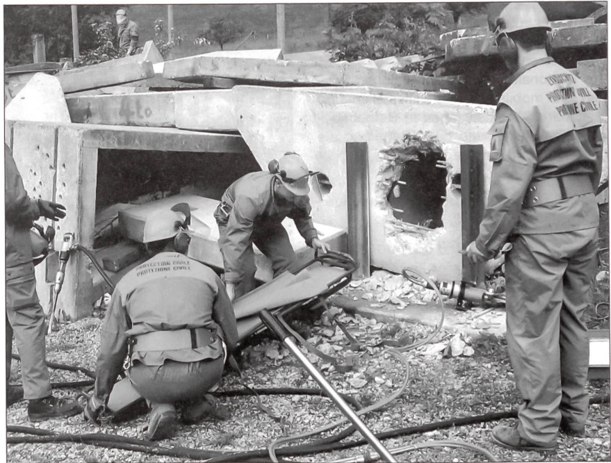
Rettung aus den Trümmern.

Der Bevölkerungsschutz besteht aus den fünf Partnerorganisationen Polizei, Feuerwehr, Gesundheitswesen, technische Be-