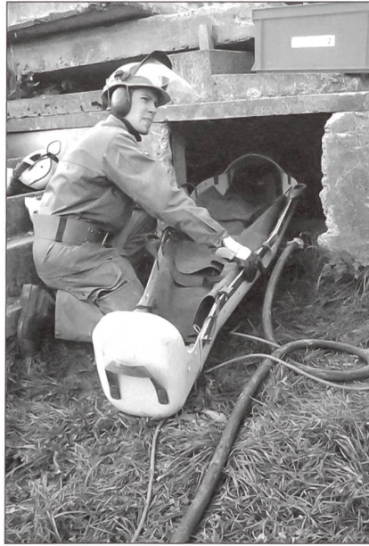
Mit der Stollenausrüstung im Einsatz.