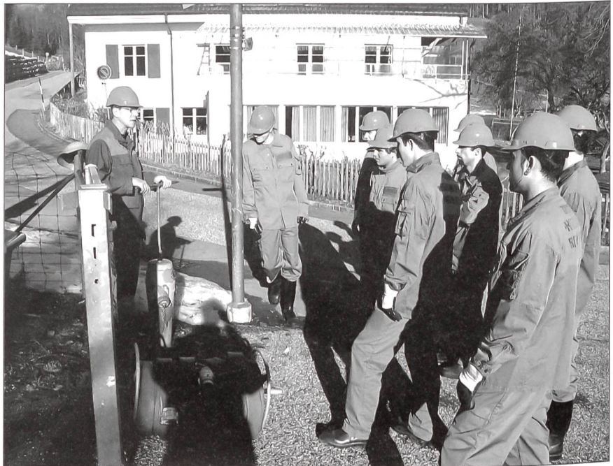
Brandbekämpfung wird in der Allgemeinen Grundausbildung erlernt.

Knappere finanzielle Ressourcen der öffentlichen Hand bedingen, dass die Mittel der Partnerorganisationen auf die aktuellen Gefährdungen ausgerichtet werden. Es werden nur diejenigen Mittel beibehalten,