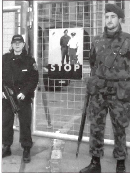
Erfolgreiche Einsätze setzen den Massstab.

Zur Rüstung wird festgestellt, dass das Schweizervolk am 18. Mai 2003 die Vorlage zur neuen Armee mit einer Dreiviertelmehrheit angenommen hat – dies auf der Grundlage, dass die personell kleiner werdende Armee diese Reduktion durch